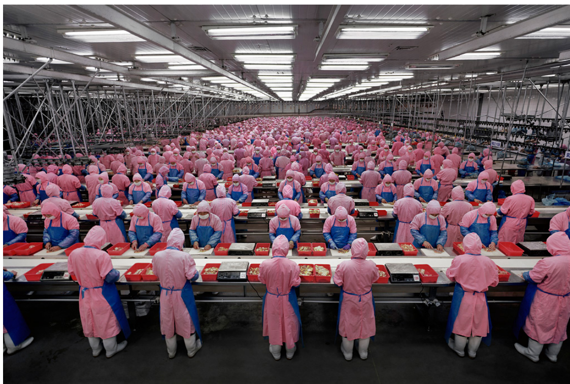
Andreas Gursky, Usine de Foxconn, Shenzhen, Chine

La guerre commerciale maladroite de Trump fait partie de cette politique – avec la lance américaine pointée vers le géant chinois de la technologie, Huawei. Les États-Unis savent que le principal avantage comparatif pour leur économie est la Silicon Valley ainsi que leur domination sur les droits de propriété intellectuelle. Cependant, dans l'arène de cette nouvelle technologie, centrée autour de la 5G, Huawei est en tête (suivi par Ericsson en Suède et Nokia en Norvège). La guerre de Trump contre Huawei n'est pas aussi irrationnelle qu'il n'y paraît (comme je le note dans la chronique de cette semaine). Son administration, comme d'autres avant elle, a exercé autant de pressions politiques que possible pour freiner la croissance de la technologie en Chine. Les accusations de vol de propriété intellectuelle et de liens étroits entre les entreprises et l'armée chinoise visent à dissuader les clients d'acheter des produits chinois. Ces accusations ont certainement entamé la marque de Huawei, mais il est peu probable qu'elles détruisent la capacité de Huawei à se développer dans le monde. Huawei affirme que les deux tiers des réseaux 5G en dehors de la Chine utilisent ses produits. Le Defence Innovation Board des États-Unis a écrit récemment que « le pays qui possède la 5G sera propriétaire de bon nombre de ces innovations et établira les normes pour le reste du monde. Pour les raisons qui suivent, il est peu probable que ce pays soit actuellement les États-Unis.