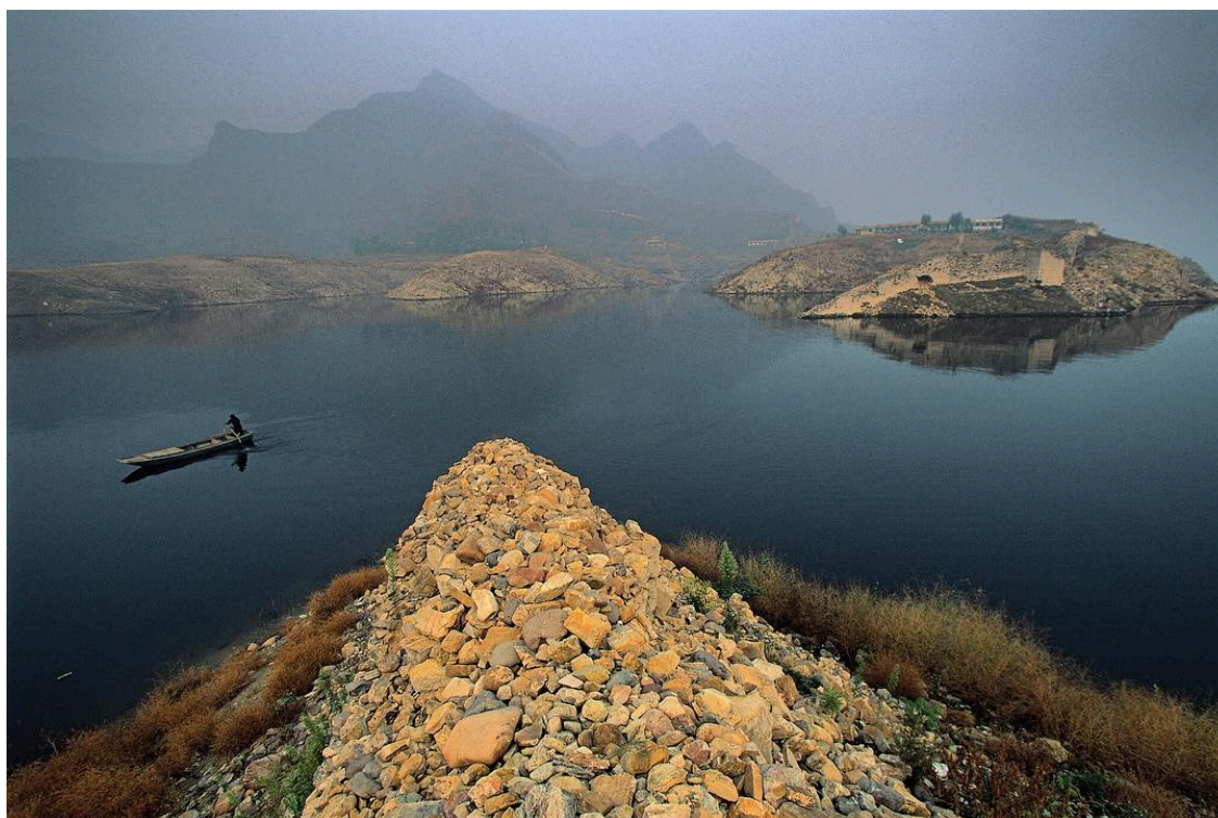
Michael Yamashita, Réservoir Panjiakou, département Qianxi, province Hebei, Chine, 2018

Mais il y a quelques faiblesses dans l'alliance sino-russe. La Chine importe principalement des matières premières de Russie – 76% des exportations sont du pétrole russe et des produits connexes – tandis que 8% des exportations sont du bois et des produits du papier. La Chine achète aujourd'hui un quart du pétrole russe, grâce au nouvel oléoduc reliant la Sibérie orientale à la Chine et aux sanctions américaines et européennes contre la Russie. Un nouveau gazoduc est en construction, ce qui ne fera qu'accroître ce commerce. La Chine, quant à elle, exporte principalement des produits finis – automobiles, biens de consommation et machines – vers la Russie. Ce déséquilibre est accentué par les faibles taux d'investissement chinois en Russie. Une partie du débat à Saint-Pétersbourg a porté sur ces questions, exacerbées par les craintes des Chinois à l'égard de l'environnement des affaires en Russie. Ces vulnérabilités fourniront une ouverture pour l'Occident.