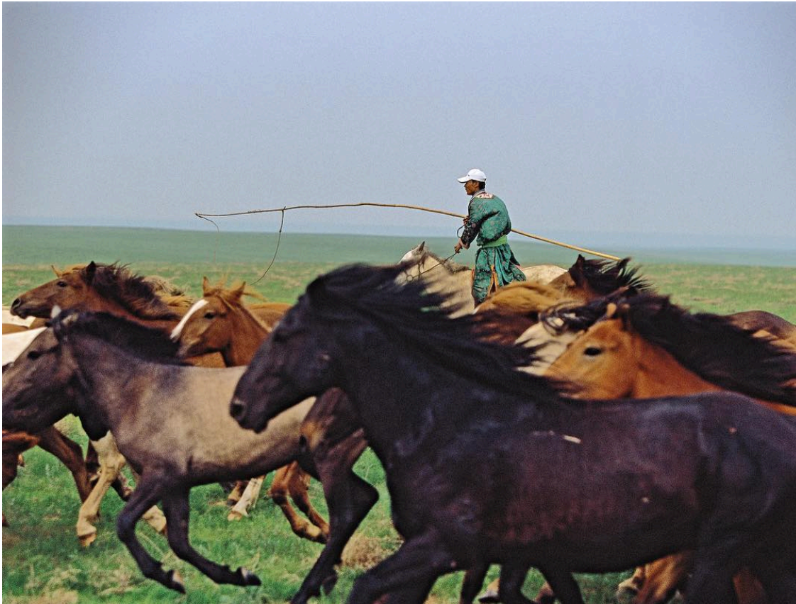
Michael Yamashita, Inner Mongolia, 2018

Au cours des deux dernières décennies, la Chine a ouvertement appelé à la création d'un ordre mondial multilatéral pour équilibrer l'ordre unilatéral produit par l'Occident après la chute de l'URSS. En 2001, le président chinois de l'époque, Hu Jintao, a déclaré que « la multipolarité [ duojihua ] constitue une base importante de la politique étrangère chinoise ». La guerre américaine contre l'Irak (2003) et la crise financière générale (2007) ont entamé l'hégémonie de l'Occident. C'est à la suite de ces deux événements que le Brésil, la Russie, l'Inde, la Chine et l'Afrique du Sud ont formé BRICS (2009). L'objectif principal du bloc était de promouvoir le multilatéralisme, c'est-à-dire de profiter de la faiblesse de l'Occident pour s'affirmer. Mais leur propre programme était limité, une version du néolibéralisme du Sud sans base institutionnelle alternative, sans vision idéologique du monde, ni puissance militaire à ses pieds. La dérive vers la droite au Brésil, en Inde et en Afrique du Sud a rapidement rendu la formation BRICS moins cohérente. C'est dans ce contexte que l'alliance entre la Chine et la Russie a occupé le devant de la scène.