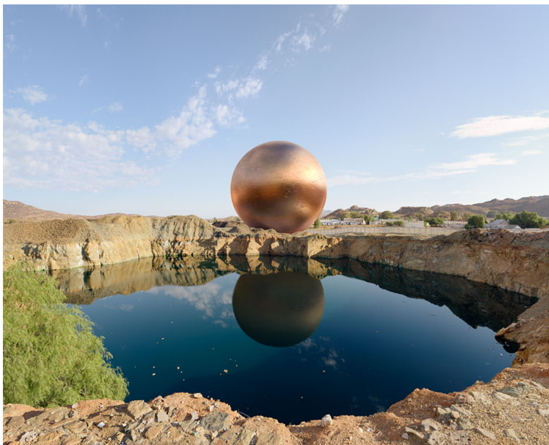
Mine O'okiep Ouest, 284 000 tonnes de cuivre, 2014