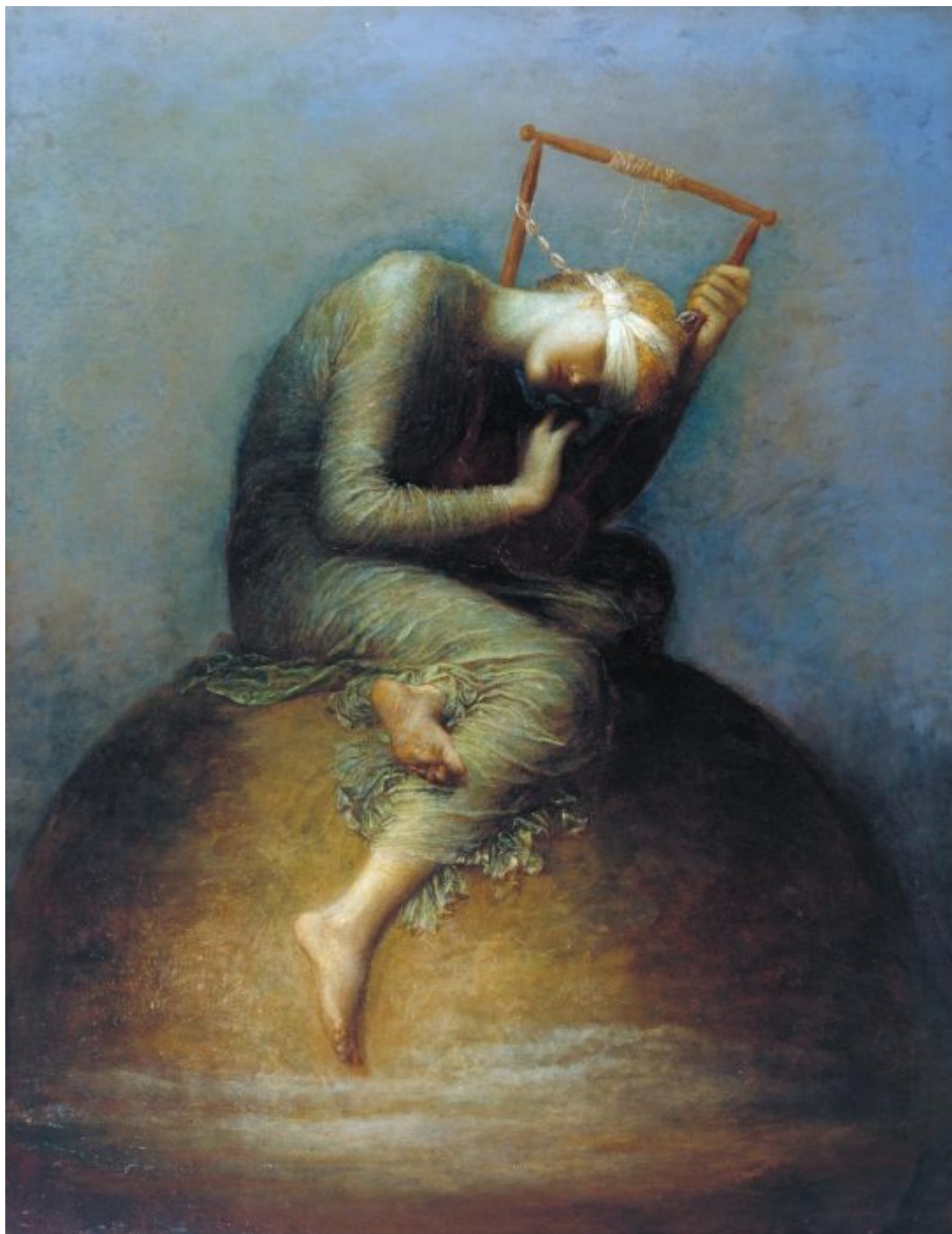
Hope 1886 George Frederic Watts 1817-1904 Presented by George Frederic Watts 1897 http://www.tate.org.uk/art/work/N01640