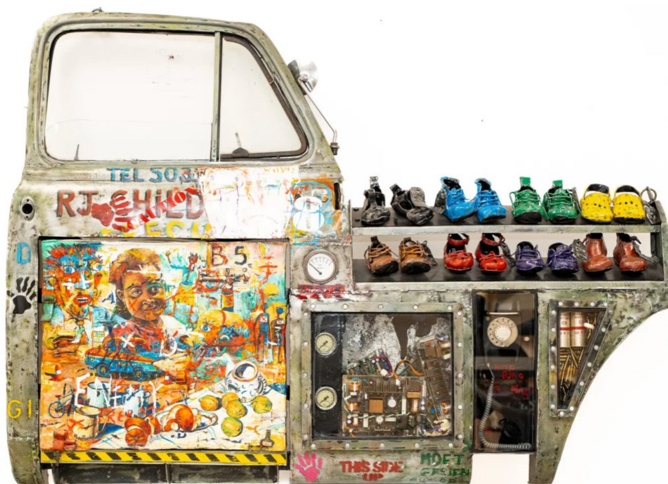
Willie Bester (Sudáfrica), Se necesita un pueblo [It Takes a Village] , 2018.