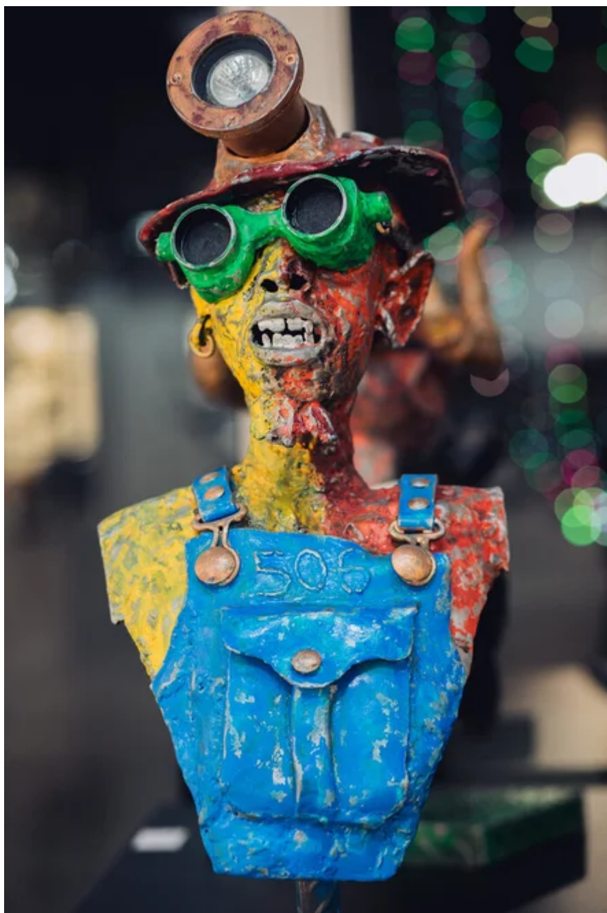
Willie Bester (Sudáfrica), Minero [Miner] , 2021.