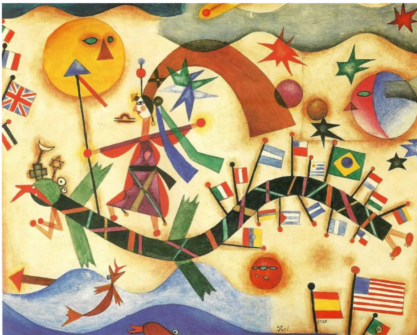
Xul Solar (Argentina), Drago , 1927.

Saludos desde la oficina Nuestra América del Instituto Tricontinental de Investigación Social,