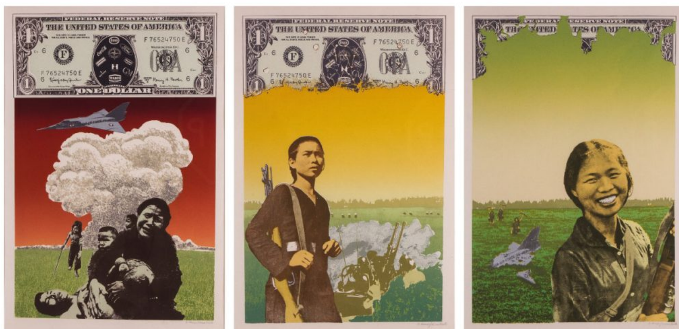
Taller 4 Rojo (Colombia), Vietnam o agresión del imperialismo a los pueblos, 1972.

Sin duda, la consolidación y la expansión de los BRICS+ (Brasil, Rusia, India, China, Sudáfrica, Egipto, Etiopía, Irán, Arabia Saudita y Emiratos Árabes Unidos) es un fenómeno central en esta aceleración de la reconfiguración en curso del orden mundial. Porque, no vamos a dejar de repetirlo, la multipolaridad es un proyecto por el que los pueblos del Sur Global debemos luchar y no un estadio ya alcanzado. Esta articulación política y económica de los BRICS+, sobre todo desde la agenda planteada en Kazan como lo ha trabajado Isabel Rauber , emergen mejores condiciones al conjunto del Sur Global para llevar adelante una agenda de desarrollo soberano, con una cooperación económica que permita romper los vínculos de dependencia histórica con el Norte Global que se han expresado a través del intercambio desigual, la fuga de capital, la dependencia del capital extranjero y la superexplotación del trabajo para garantizar el funcionamiento de la maquinaria expansiva del imperialismo global.