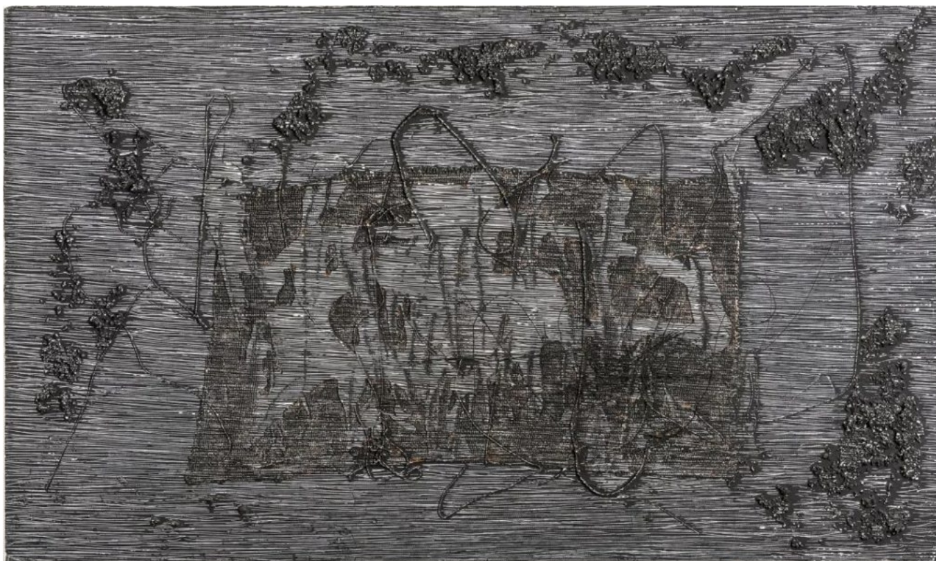
Jesús Rafael Soto (Venezuela), Barroco negro , 1961.