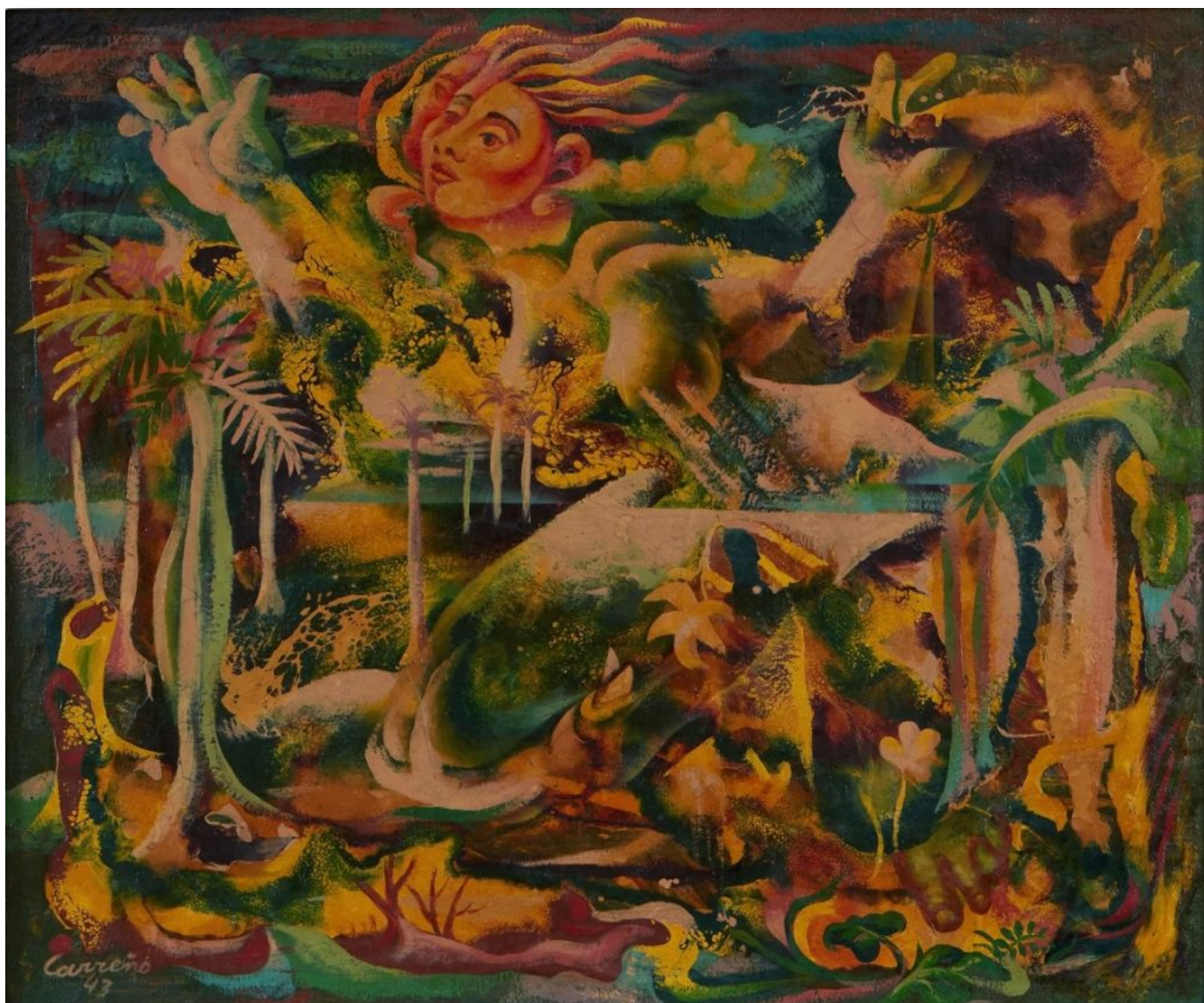
Mario Carreño (Cuba), Alegoría de un paisaje cubano , 1943.