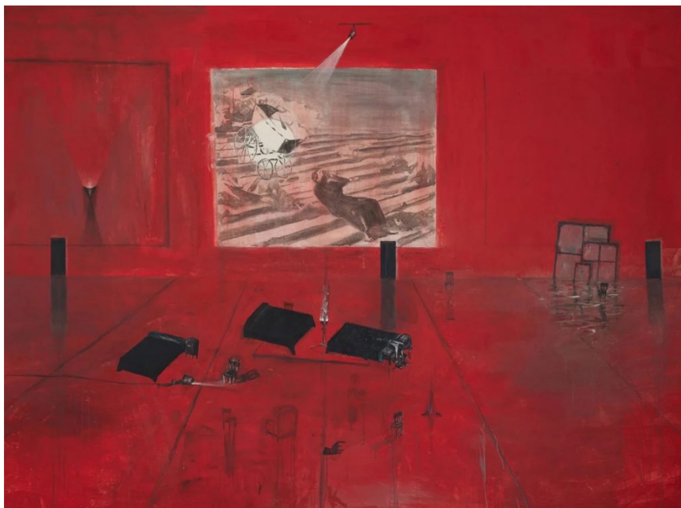
Guillermo Kuitca (Argentina), El mar dulce , 1989.