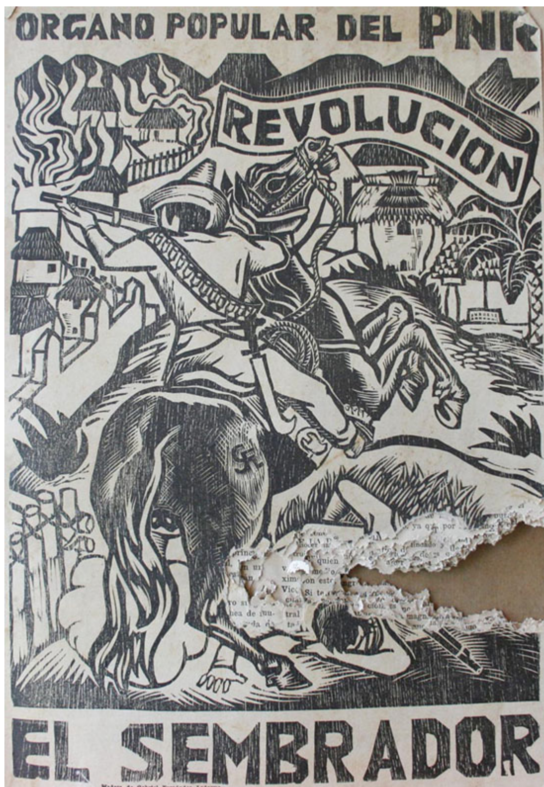
Gabriel Fernández Ledesma (México), Portada de El Sembrador , 1930.

Para el pueblo venezolano, se deben adoptar las siguientes medidas: