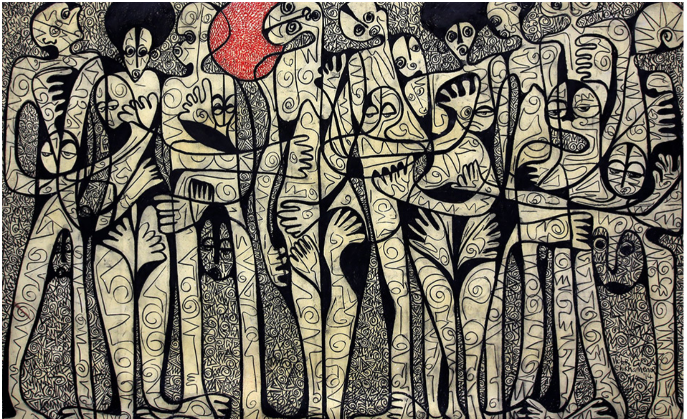
Victor Ehikhamenor (Nigeria), Lagos Hide and Seek [Escondidas en Lagos], 2014.

de la necesidad de la humanidad de recuperar colectivamente el aire, el agua y la tierra del planeta y detener la locura militar nuclear de Estados Unidos. El capitalismo rechaza la planificación y la paz. El Sur Global (incluida China) puede ayudar al mundo a construir y ampliar una «zona de paz» y comprometerse a vivir en armonía con la naturaleza.