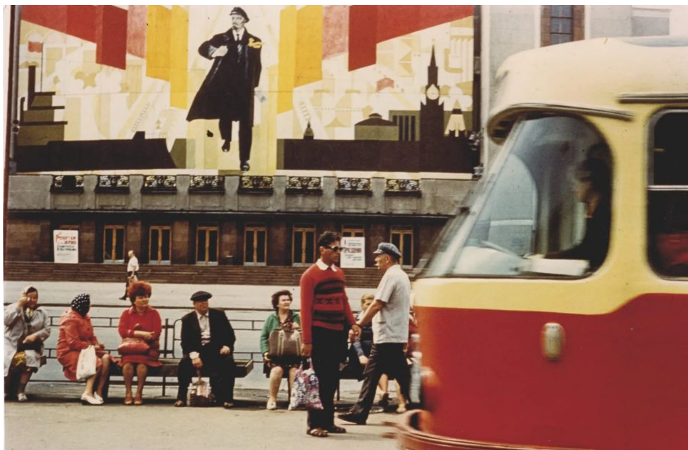
Boris Mikhailov (RSS Ucrania), Red [Rojo], 1968-1975.