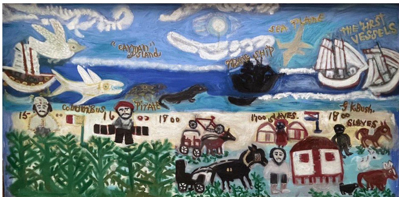
Gladwyn K. Bush or Miss Lassie (Islas Caimán), The History of the Cayman Islands [La historia de las Islas Caimán], s. f.

Ni una sola vez el informe de la ONU hace referencia a ningún país concreto, ni trata de identificar adecuadamente a las potencias emergentes. Al no proporcionar un análisis específico de la situación actual, la ONU acaba aportando el tipo de soluciones vagas que se han convertido en habituales y carecen de sentido (como aumentar la confianza y fomentar la solidaridad). Hay una propuesta específica muy significativa, relativa al comercio de armas, sobre la que volveré al final de este boletín. Pero aparte de mostrar su preocupación por la creciente industria armamentística, el informe de la ONU intenta erigir una especie de andamiaje moral sobre las duras realidades que no puede afrontar directamente.