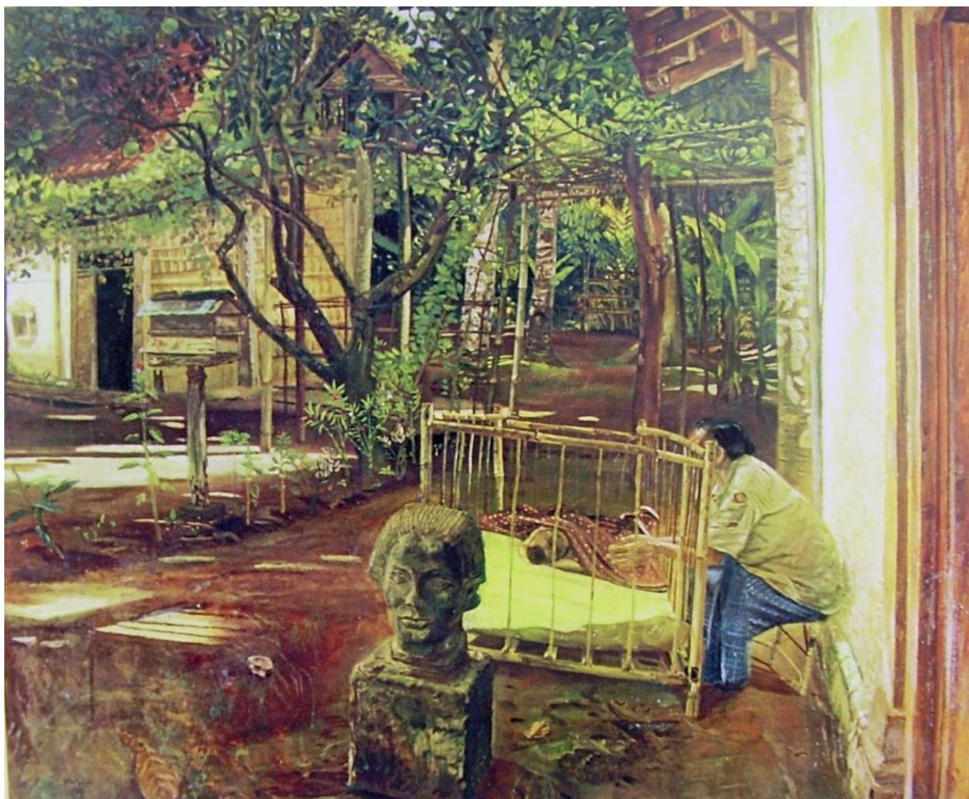
S. Sudjojono (Indonesia), Di Dalam Kampung [En el pueblo], 1950.

En segundo lugar, fue asombroso para países como China, India e Indonesia que el G20 les pidiera que proporcionarán liquidez al reseco sistema bancario del Norte Global en 2007-2008. La confianza de estos países en desarrollo en Occidente disminuyó, mientras que la percepción de sí mismos mejoró. Fue este cambio de circunstancias el que llevó a la formación del bloque BRICS en 2009 por Brasil, Rusia, India, China y Sudáfrica, las “locomotoras del Sur”, como teorizó la Comisión del Sur en los años ochenta y profundizó más tarde en su poco leído informe de 1991. El crecimiento de China por sí mismo fue asombroso, pero, como señaló la Conferencia de las Naciones Unidas sobre Comercio y Desarrollo (UNCTAD) en 2022, lo fundamental fue que China fue capaz de lograr una transformación estructural (es decir, pasar de actividades económicas de baja productividad a otras de alta productividad). Esta transformación estructural podría proporcionar lecciones para el resto del Sur Global, lecciones mucho más prácticas que las ofrecidas por el programa de deuda-austeridad del Fondo Monetario Internacional.