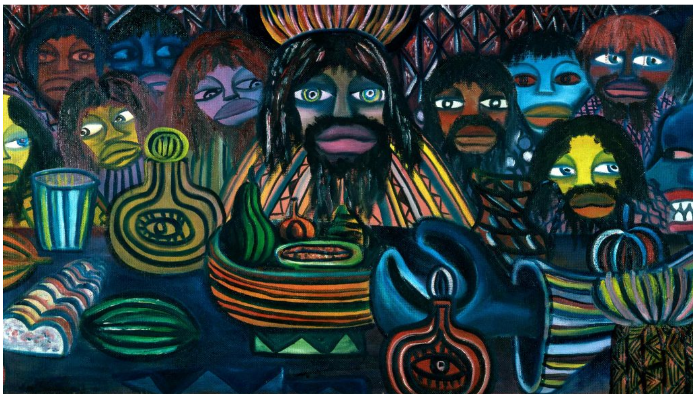
Malangatana Valente Ngwenya (Mozambique), Última Ceia [La última cena], 1964.

Es fácil descartar este enfoque como ingenuo. Pero, ¿es mero idealismo insistir en que ningún niño debería morir a causa de una enfermedad prevenible transmitida por los alimentos?