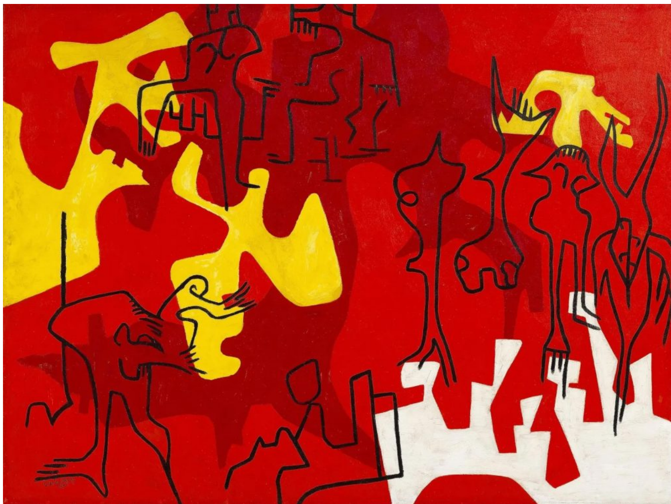
Uche Okeke (Nigeria), Ana Mmuo [La tierra de los muertos], 1961.

en sus orígenes. El desafío que enfrenta la humanidad no es simplemente hacer que los alimentos sean más seguros. Se trata de construir sistemas alimentarios organizados en torno al cuidado en lugar de las ganancias, a la salud pública en lugar de la acumulación privada, y a la dignidad humana en lugar de la eficiencia del mercado. Solo así la promesa de alimentos seguros para todas las personas podrá convertirse en una realidad y no solo en un eslogan.