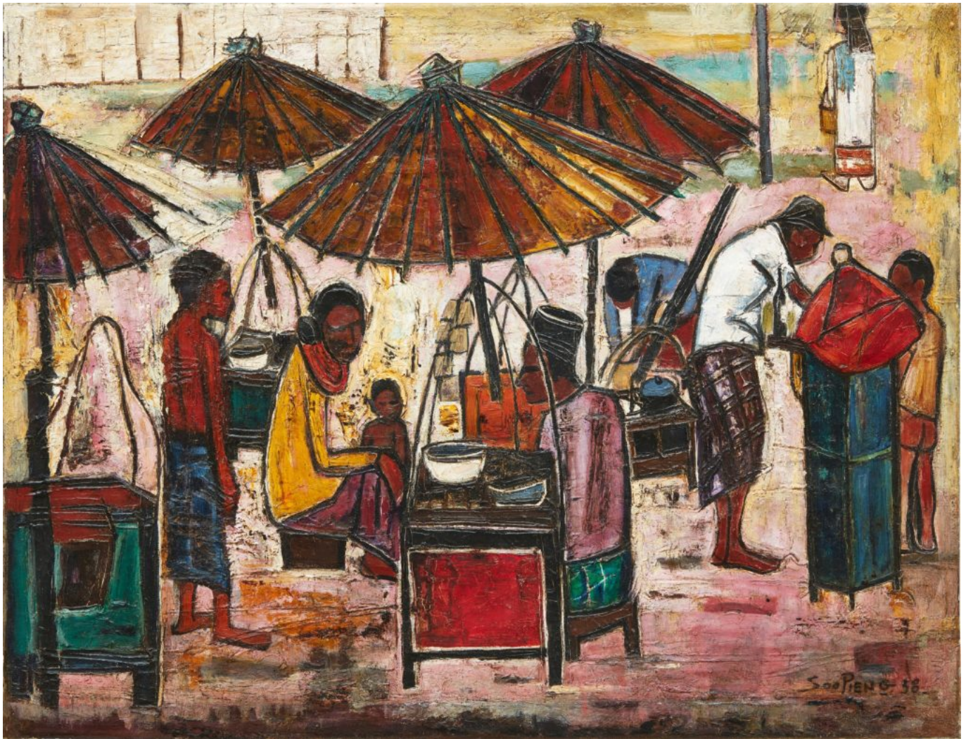
Cheong Soo Pieng (Singapur), Satay Sellers [Vendedores de satay], 1958.

Además, la seguridad alimentaria no puede separarse de la crisis más amplia de los sistemas alimentarios. En todo el mundo, millones de personas padecen hambre, mientras que otras se enfrentan a la obesidad y a enfermedades relacionadas con la alimentación. Lxs agricultorxs se ven abocados a la deuda, mientras que las corporaciones alimentarias acumulan un poder de mercado sin precedentes. La producción agrícola contribuye a la destrucción ecológica, a la par que el cambio climático amenaza las cosechas. El mismo sistema que genera inseguridad alimentaria también genera alimentos no seguros. La contradicción es sorprendente. La humanidad cuenta con el conocimiento científico, la capacidad productiva y los medios tecnológicos para garantizar alimentos seguros para todas las personas. Sin embargo, bajo los acuerdos económicos vigentes, estas capacidades están subordinadas a la rentabilidad en lugar de a las necesidades humanas.