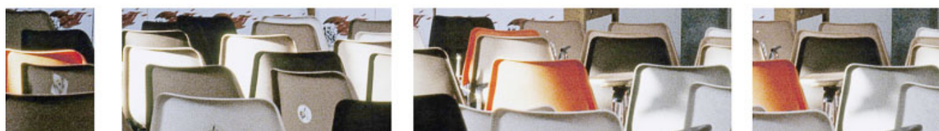
Los organizadores se preparan para la primera sesión del Simposio y Festival de las Artes "Cultura y Resistencia", Gaborone, Botsuana, 1982.