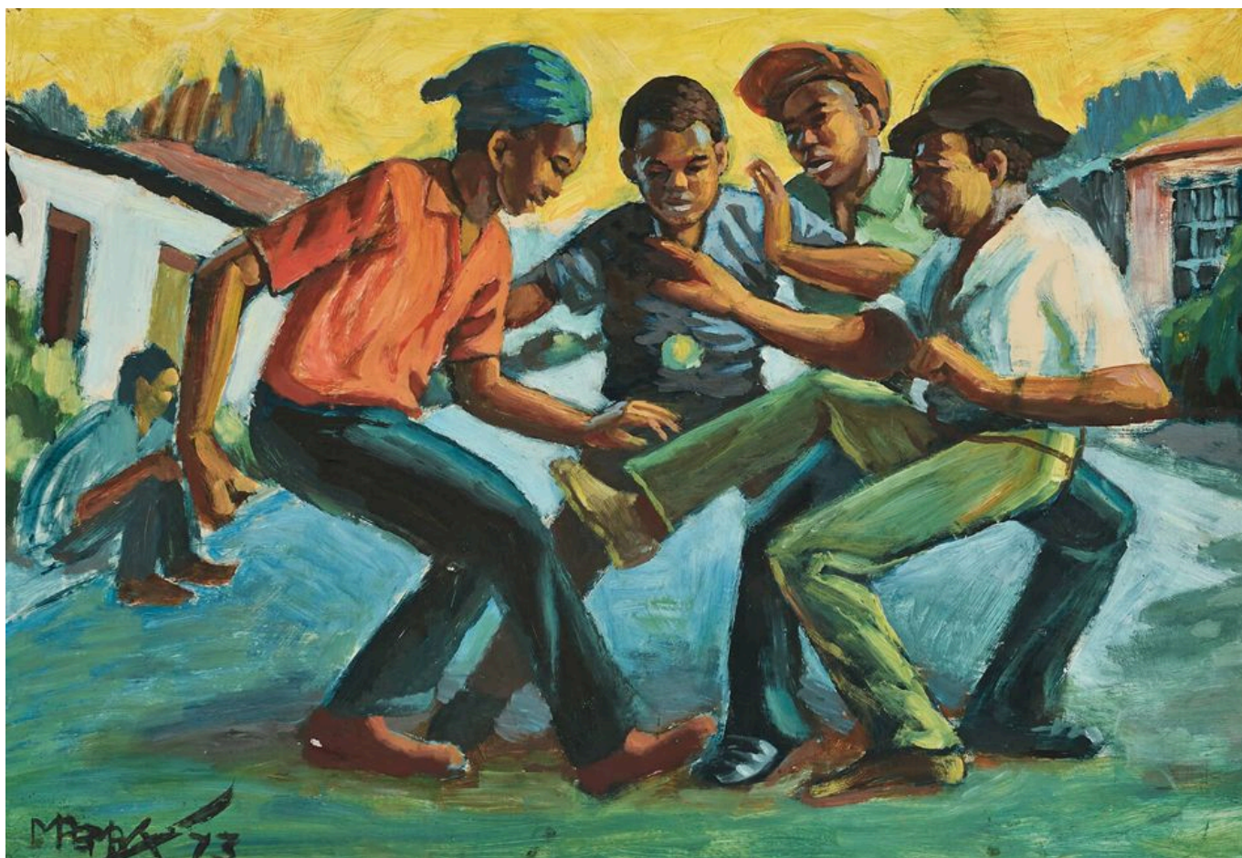
George Pemba (Sudáfrica), Township Games [Juegos de la barriada], 1973.

En mayo de este año, 30 años después del fin del apartheid, Sudáfrica celebró sus séptimas elecciones generales de la era post-apartheid, con unos resultados que contrastan fuertemente con los de México. La alianza tripartita gobernante —formada por el Congreso Nacional Africano (CNA), el Partido Comunista Sudafricano y el Congreso de Sindicatos Sudafricanos— sufrió un enorme desgaste en su porcentaje de votos, obteniendo solo el 40,18% (42 escaños menos que la mayoría), frente al 59,50% y una cómoda mayoría en la Asamblea Nacional en 2019. Lo sorprendente de las elecciones no es solo el descenso de la cuota de votos de la alianza, sino el rápido declive de la participación electoral. Desde 1999, cada vez menos personas se han molestado en ir a votar, y esta vez solo el 58% de los electores acudieron a las urnas (frente al 86% de 1994). Esto significa que la alianza tripartita solo obtuvo los votos del 15,5% de los electores, mientras que sus rivales obtuvieron porcentajes aún menores. No se trata únicamente de que la población sudafricana —como la de otros lugares— esté harta de tal o cual partido político, sino de que está cada vez más desilusionada con su proceso electoral y con el papel de los políticos en la sociedad.