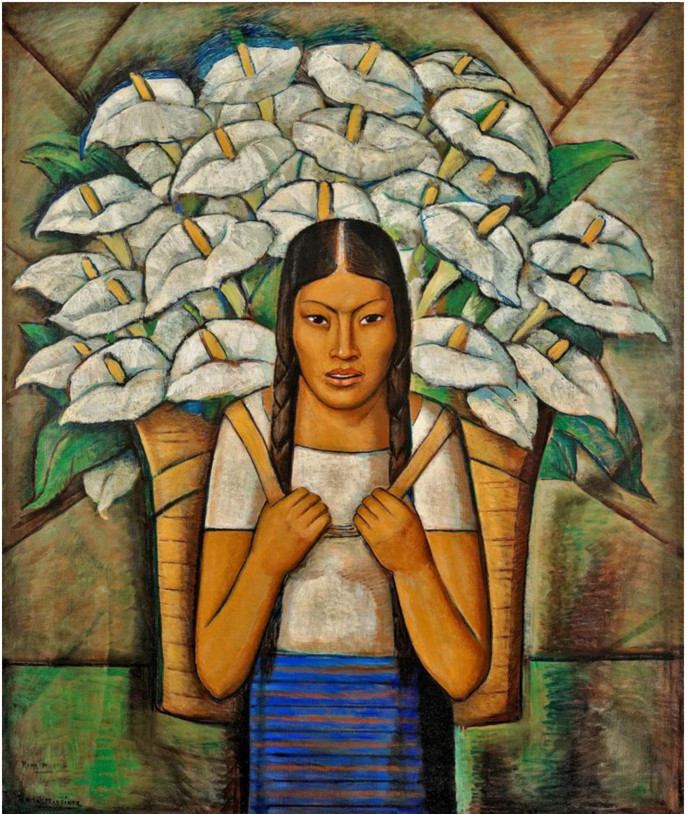
Alfredo Ramos Martínez (México), Vendedora de alcatraces , 1929.

En las últimas semanas se han celebrado tres elecciones especialmente importantes en India, México y Sudáfrica. India y Sudáfrica son actores clave del bloque BRICS , que está trazando un camino hacia un orden