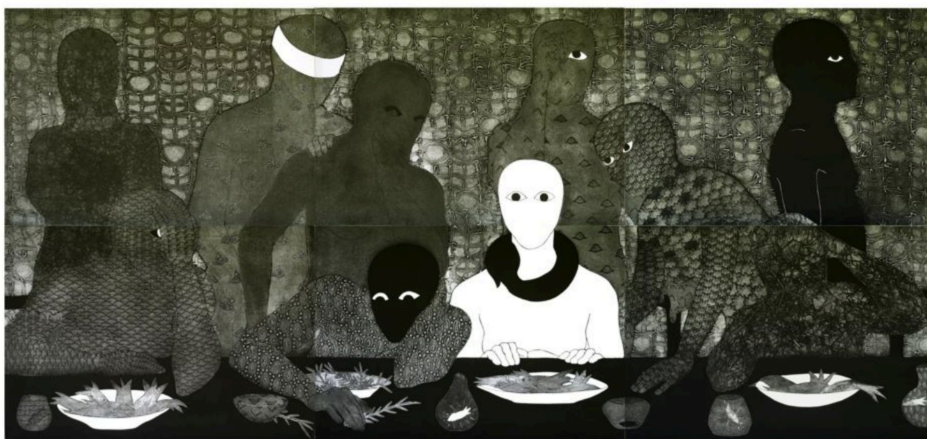
Belkis Ayón (Cuba), La cena , 1991.

Ucrania. Un nuevo proyecto de ley de gastos suplementarios que asciende a 105.000 millones de dólares (además del presupuesto militar de 858.000 millones de dólares para 2023, probablemente infravalorado ) incluye 61.400 millones de dólares para la guerra devastadora en Ucrania y 14.100 millones de dólares para el genocidio israelí del pueblo palestino. Aunque se iniciaron conversaciones de paz entre las autoridades ucranianas y rusas, tanto en Bielorrusia como en Turquía, días después de la entrada de las tropas rusas en Ucrania, la OTAN las frustró precipitadamente, lo que avivó el conflicto que, hasta la fecha, ha causado la muerte de casi 10.000 civiles. La cifra de civiles muertos en Ucrania durante un año y ocho meses de conflicto ya ha sido superada por la de civiles muertos en Palestina en apenas cuatro semanas.