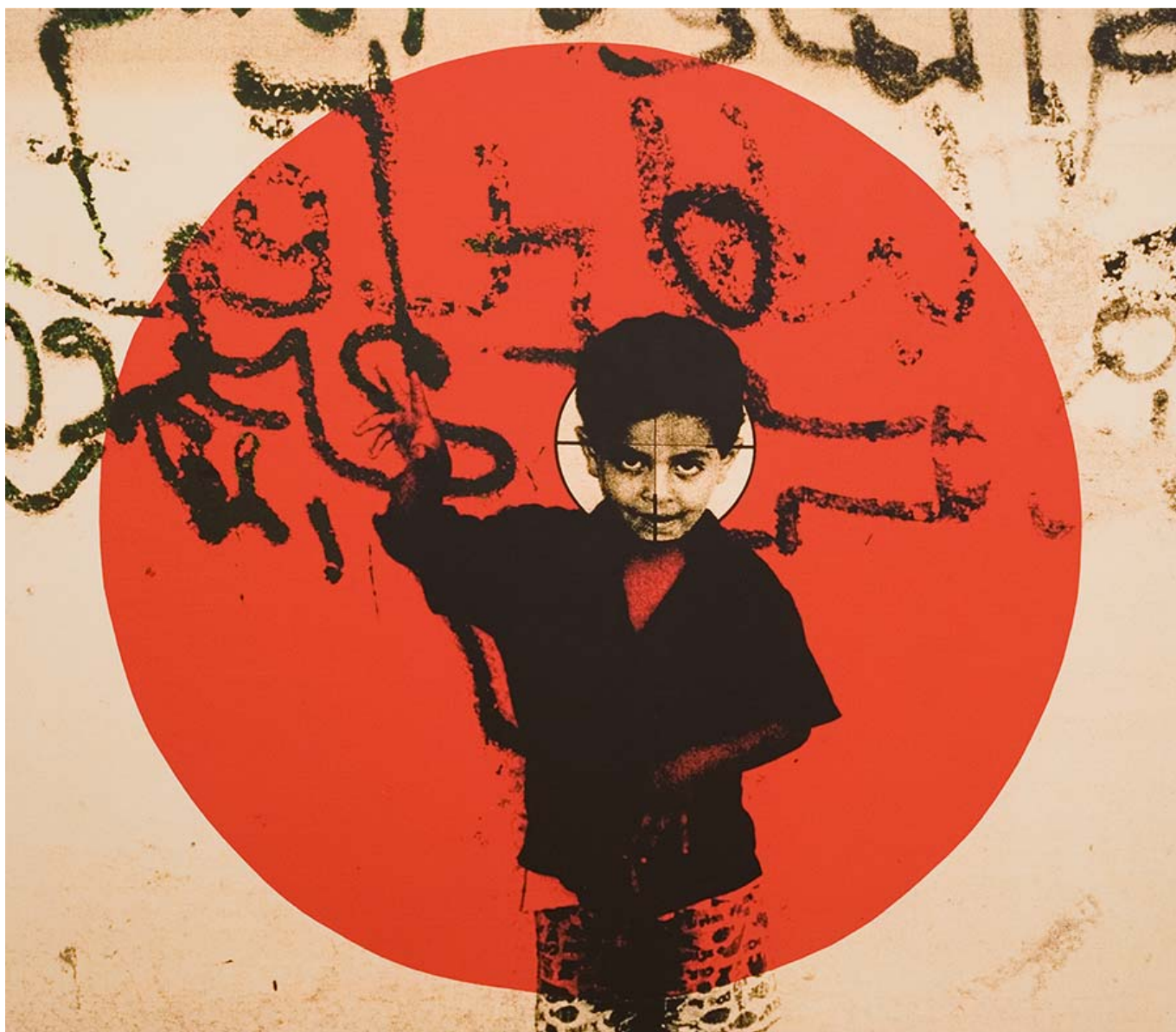
Laila Shawa (Palestina), Target 2009 [Objetivo 2009], 2009.

Incluso cuando altos funcionarios estadounidenses hablan de una “pausa humanitaria”, siguen destinando miles de millones de dólares y más sistemas de armamento al ejército israelí. Esta idea de una “pausa humanitaria” es jerga legal que no significa nada para la supervivencia de las y los gazatíes: la pausa pondría fin a los bombardeos durante un breve periodo de tiempo, posiblemente solo unas horas, para permitir que se retire a los heridos y que entre algo de ayuda en la ciudad de Gaza antes de dar luz verde a los israelíes para reanudar su bombardeo asesino. Hasta ahora, Israel ha lanzado sobre Gaza un tonelaje de explosivos superior al peso combinado de las dos bombas lanzadas sobre Hiroshima y Nagasaki en 1945.