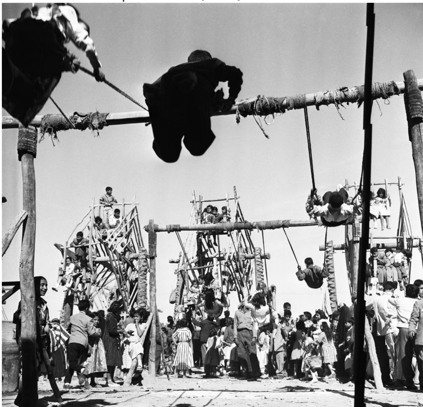
Latif al-Ani (Irak), Eid festivities in Baghdad [Celebraciones de Eid en Bagdad], 1959.