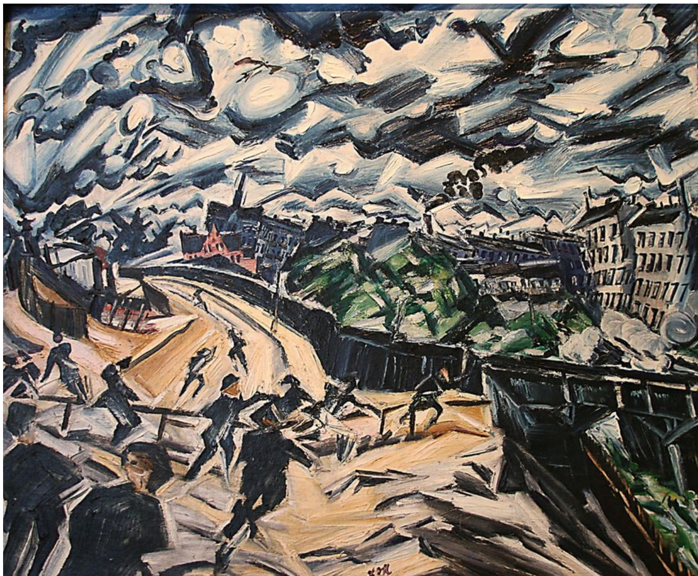
Ludwig Meidner (Alemania), Apocalyptic Landscape [Paisaje apocalíptico], 1913.

una guerra híbrida impuesta por Estados Unidos (como las sanciones y la guerra de información) y un deseo de desmembrar a estos países y luego dominarlos a perpetuidad.