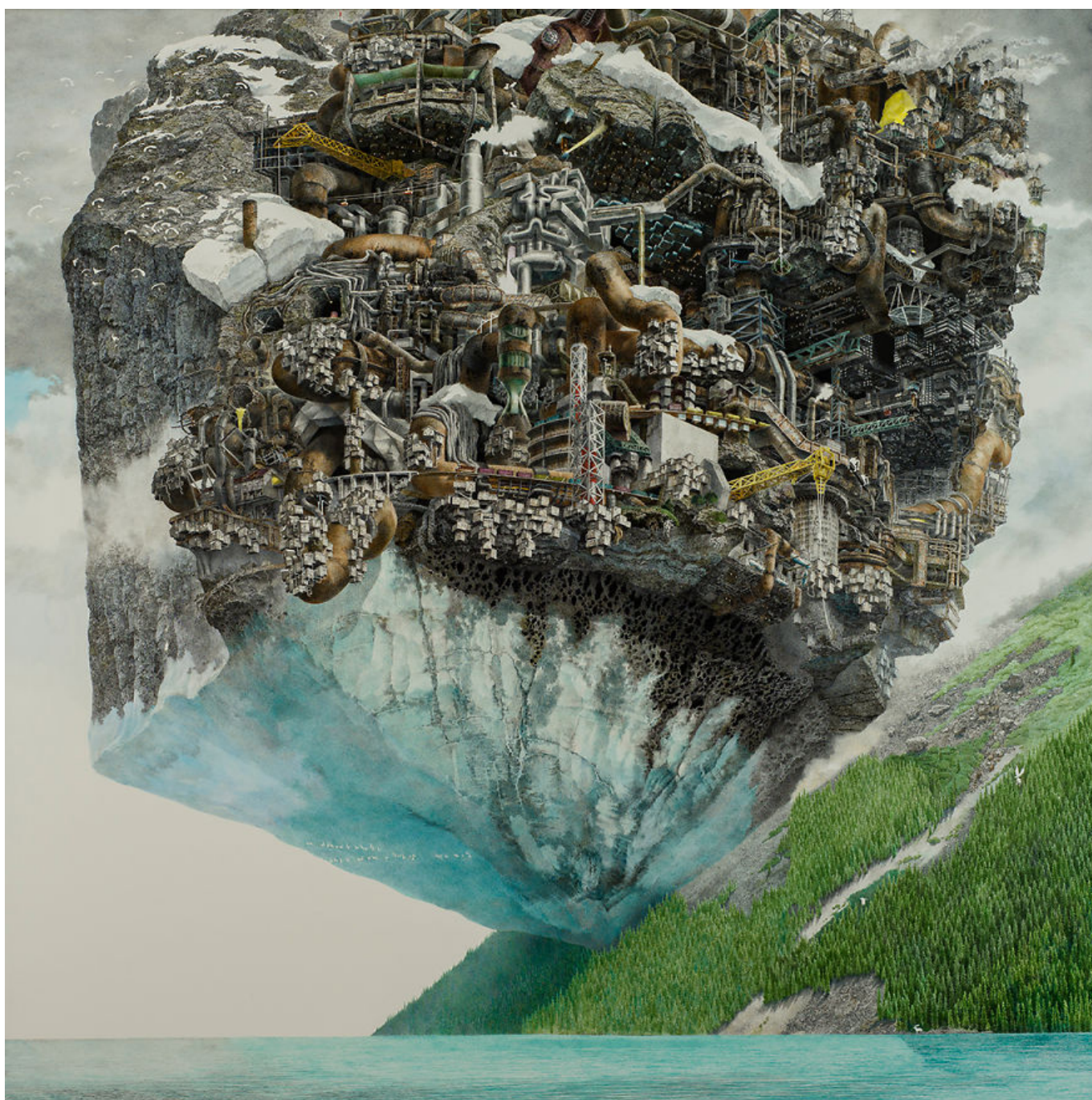
Ikeda Manabu (Japón), Meltdown ('El derretimiento'), 2013.

los países en desarrollo en general y frente a China en particular. Según el Fondo Monetario Internacional (FMI), en 2016 China superó a EE.UU. como la mayor economía del mundo. En 2021, China representaba el 19% de la economía mundial, frente al 16% de EE. UU. Esta diferencia es cada vez mayor y, para 2027, el FMI prevé que la economía china superará a la estadounidense en casi un 30%. Sin embargo, Estados Unidos ha mantenido una supremacía militar mundial sin parangón: su gasto militar es mayor que el de los siguientes nueve países que más gastan combinados. Para mantener su dominio mundial unipolar, Estados Unidos sustituye cada vez más la competencia económica pacífica por la fuerza militar.