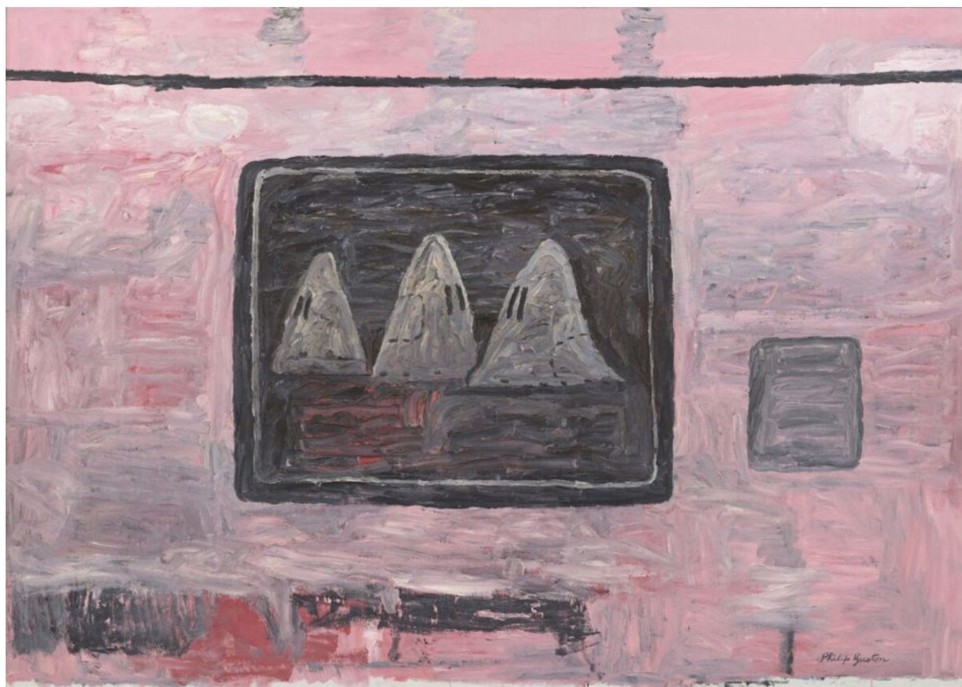
Philip Guston (Canadá), Blackboard ('La pizarra'), 1969.

El próximo año, 2023, será el bicentenario de la Doctrina Monroe, con la que Estados Unidos afirmó su hegemonía sobre el hemisferio americano. El espíritu maligno de la Doctrina Monroe no solo continúa, sino que ahora ha sido ampliado por el gobierno estadounidense en una especie de Doctrina Monroe global . Para hacer valer esta absurda pretensión sobre todo el planeta, EE. UU. ha llevado a cabo una política para «debilitar» a los que considera «rivales cercanos», es decir, China y Rusia.