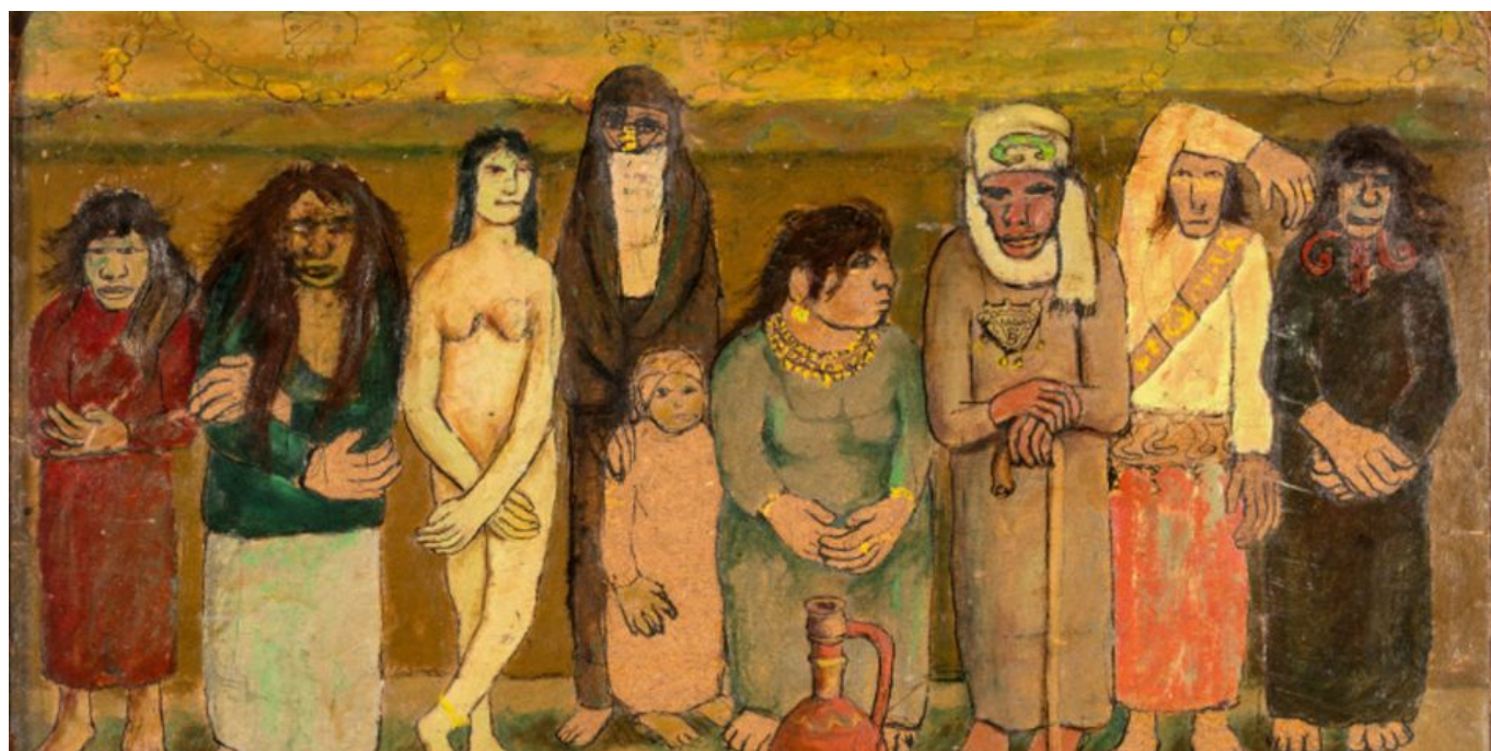
Abdel Hadi el-Gazzar (Egipto), The Popular Chorus or Food or Comrades on the Theatre of Life [El coro popular o La comida o Camaradas en el teatro de la vida], 1948 (fechado en 1951).