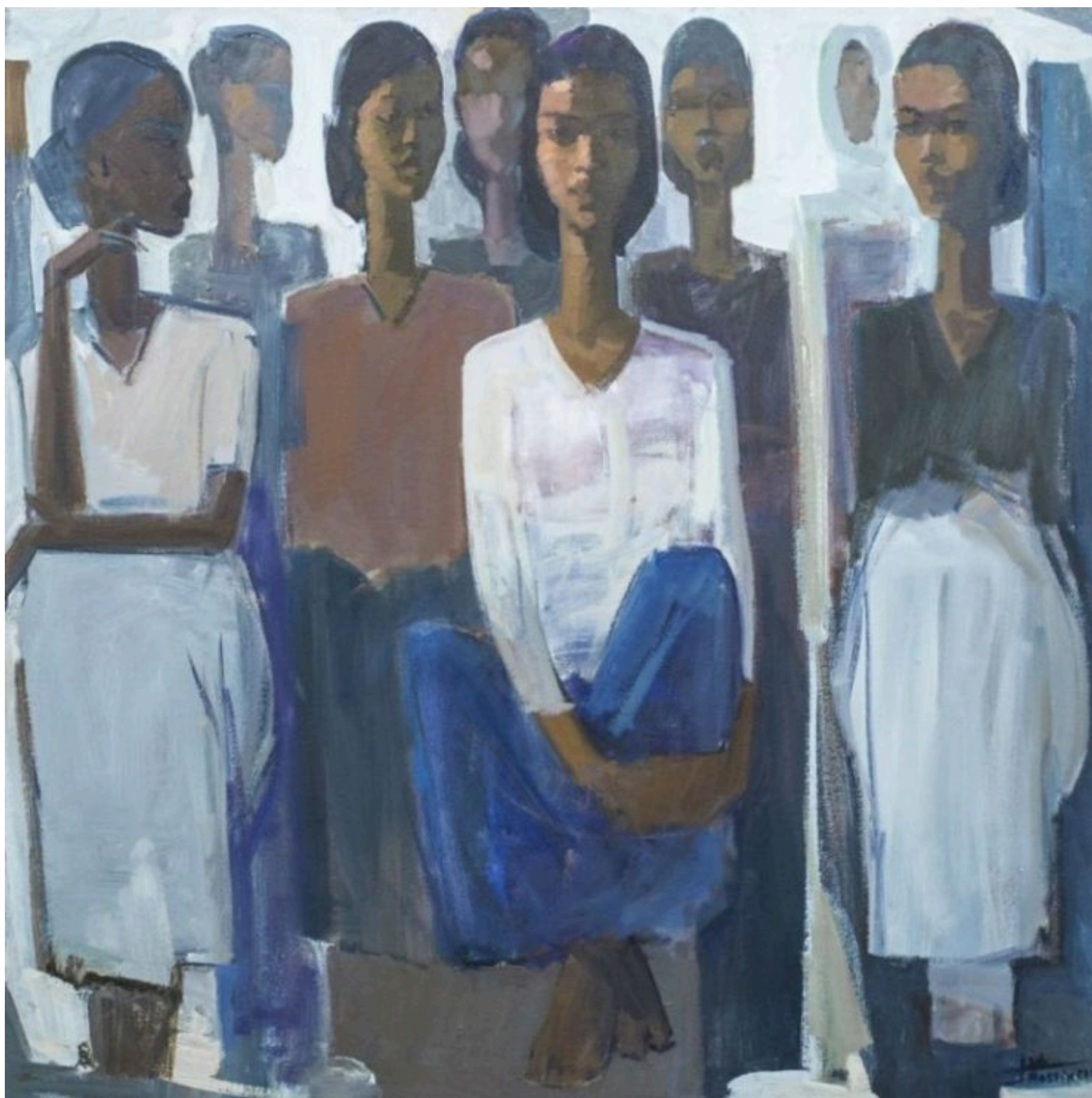
Tadesse Mesfin (Etiopía), Pillars of Life: Waiting [Pilares de la vida: Esperar], 2018.

El bloque BRICS no opera con independencia de las nuevas formaciones regionales que aspiran a construir plataformas fuera de las garras de Occidente, como la Comunidad de Estados Latinoamericanos y Caribeños (CELAC) y la Organización de Cooperación de Shanghai (OCS). En cambio, la pertenencia al bloque BRICS tiene el potencial de fortalecer el regionalismo para quienes ya forman parte de estos foros. Ambos conjuntos de organismos interregionales son parte de una marea histórica respaldada por importantes datos, analizados por el Instituto Tricontinental de Investigación Social utilizando una serie de bases de datos