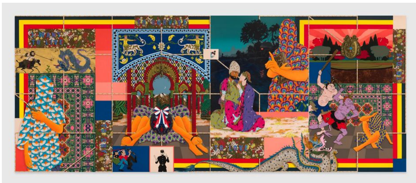
Amir H. Fallah (Irán), I Want To Live, To Cry, To Survive, To Love, To Die [Quiero Vivir, Llorar, Sobrevivir, Amar, Morir], 2023.

En su comunicado, las naciones BRICS plantean la importancia de una “reforma integral de la ONU, incluido su Consejo de Seguridad”. Actualmente, el Consejo de Seguridad de la ONU tiene quince miembros, cinco de los cuales son permanentes (China, Francia, Rusia, Reino Unido y Estados Unidos). No hay miembros permanentes de África, América Latina ni del país más poblado del mundo, India. Para reparar estas desigualdades, el bloque BRICS ofrece su apoyo a “las legítimas aspiraciones de los países emergentes y en desarrollo de África, Asia y América Latina, incluidos Brasil, India y Sudáfrica, de desempeñar un papel más importante en los asuntos internacionales”. La negativa de Occidente a conceder a estos países un puesto permanente en el Consejo de Seguridad de la ONU no ha hecho sino reforzar su compromiso con el proceso BRICS y potenciar su papel en el G20.