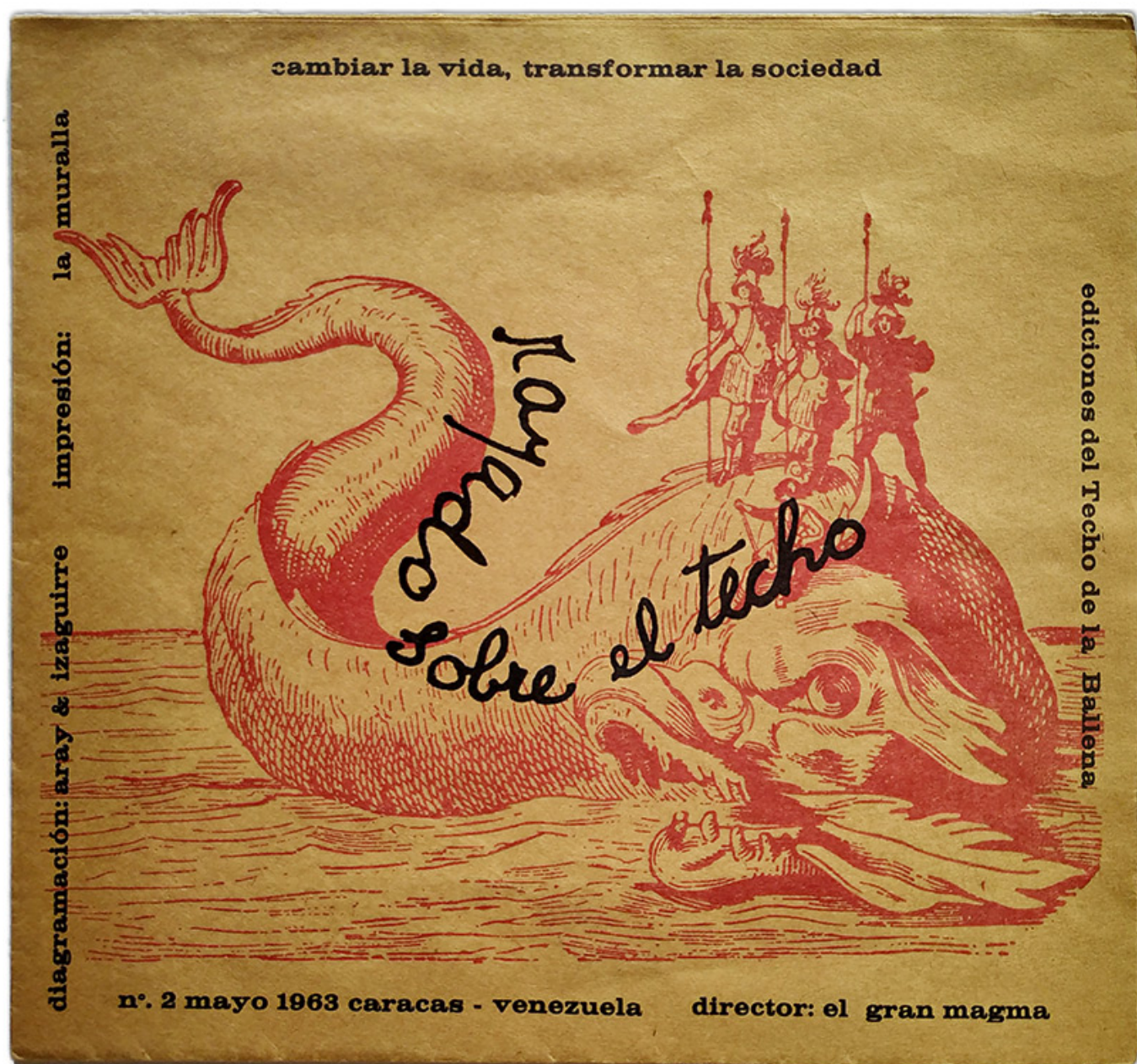
El Techo de la Ballena (colectivo de artistas), Cambiar la vida, transformar la sociedad , 1963.

¿Qué hace que el ataque contra Venezuela sea ilegal? Teniendo en cuenta que Estados Unidos ignora completa y sistemáticamente el derecho internacional, incluso mientras habla de un “orden internacional basado en reglas”, vale la pena revisar los fundamentos del derecho internacional y examinar las leyes internacionales que ese país violó con su ataque contra Venezuela el 3 de enero.