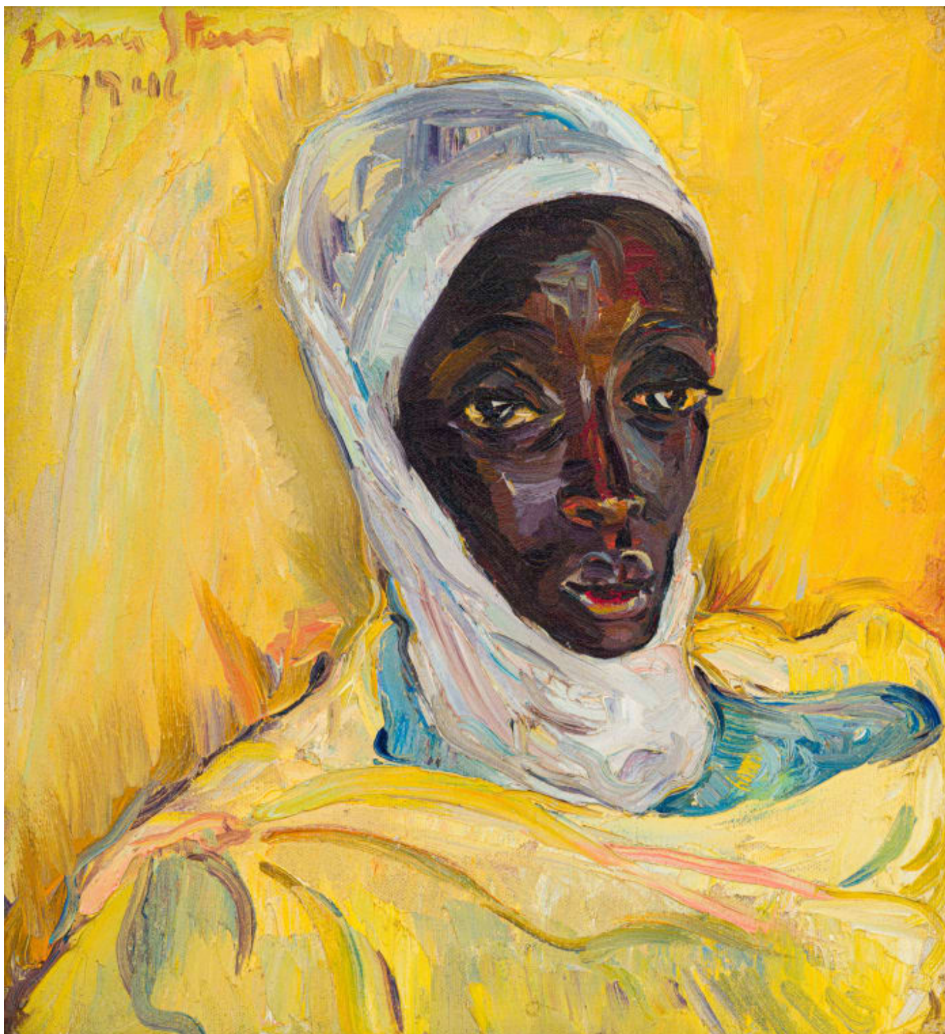
Irma Stern (Sudáfrica), Watussi Chief's Wife in Yellow , [La esposa del jefe watussi vestida de amarillo], 1946.

El futuro no lo decidirán los cálculos de las élites ni la benevolencia de las instituciones. Lo decidirá la organización. Las clases dominantes están organizadas a nivel global a través de corporaciones, bancos, sistemas mediáticos y alianzas militares. Los pueblos del mundo deben organizarse con la misma seriedad. Esto requiere paciencia, claridad ideológica y confianza en la política socialista, no como nostalgia, sino como necesidad. La unidad es esencial. Una izquierda viva siempre contendrá diferentes tradiciones y debates, pero