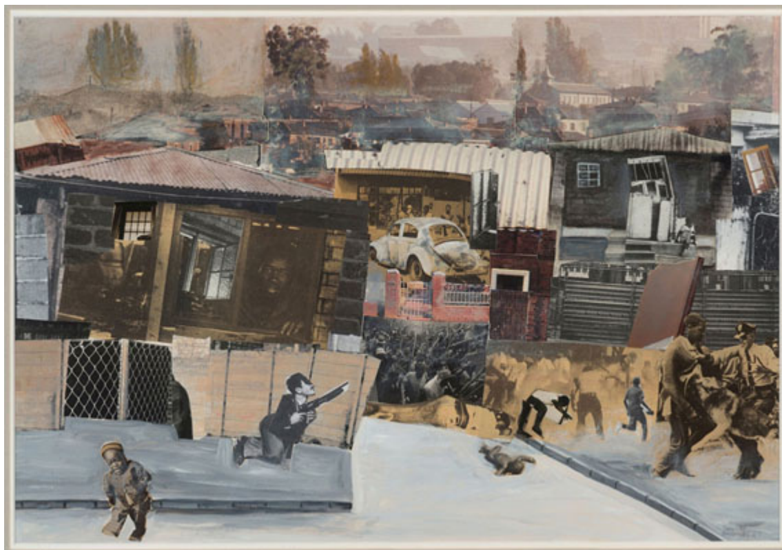
Sam Nhlengethwa (Sudáfrica), Very Ugly [Muy feo], 1992.

Nos apoyamos en más de un siglo de luchas organizadas de la clase trabajadora, el campesinado y por la liberación nacional. Estas luchas encontraron su expresión en la Comuna de París (1871), la Revolución Rusa (1917), la Revolución Vietnamita (1945), la Revolución China (1949), la Revolución Cubana (1959) y una serie de victorias anticoloniales, incluidos los notables y poco comprendidos acontecimientos que están teniendo lugar en el Sahel . Un debate sobre la izquierda no tiene por qué comenzar con desesperanza. La clase trabajadora y el campesinado deben estar orgullosos de su papel clave en estas luchas y en el intento de ir más allá del capitalismo y forjar una sociedad socialista.