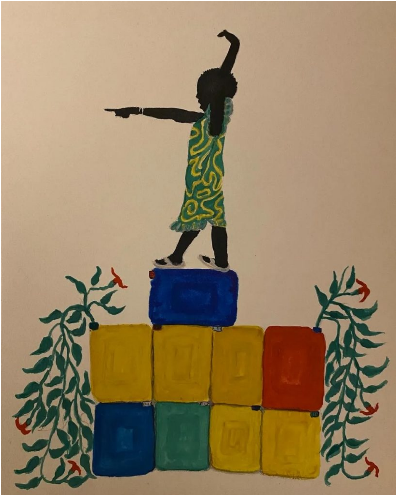
Saïdou Dicko (Burkina Faso), The Water Statue [La estatua de agua], 2020.