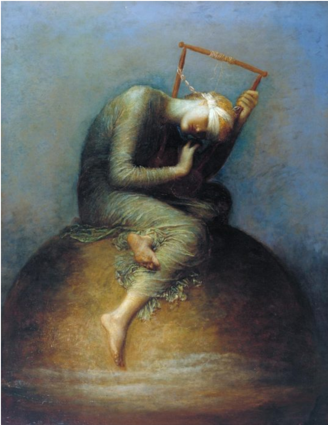
George Frederic Watts, Hope [Esperanza] , 1886.

Chile limita con Argentina y Bolivia. En Argentina, las elecciones presidenciales expulsaron a Macri, quien resultó herido por su regreso al FMI. En Bolivia, Evo Morales mantuvo su puesto por un cuarto periodo. Sus victorias son importantes, aunque tienen un “espacio de políticas” limitado. Evo ha luchado por ampliar ese espacio, por empujar lo más fuerte posible para llevar a Bolivia en una dirección progresista. Mientras la tasa de crecimiento de Chile se queda en 1,7%, Bolivia creció a un 4,2%. Pero estas cifras no son suficiente. La presión del imperialismo reduce