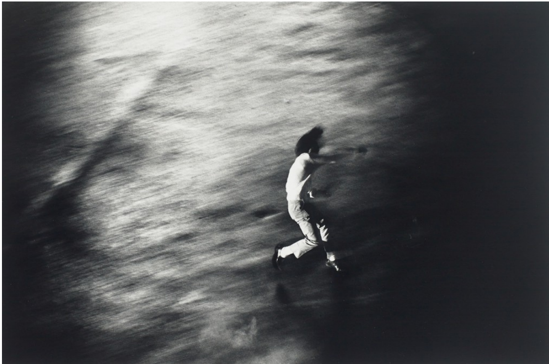
Shomei Tomatsu, Protest 1, Oh! Shinjuku, 1969

Tome dos electrodomésticos: la cocina sin humo y el congelador. La cocina sin humo es esencial para el desarrollo social, una solución tangible y factible a las enfermedades causadas por las cocinas convencionales que impactan desproporcionadamente a las mujeres que dependen de ellas para alimentar a sus familias. Miles de laboratorios universitarios han creado estas estufas. Pero siguen ausentes en muchos hogares, desde el Nepal rural al México urbano. ¿Por qué? Bueno, las personas que las necesitan no tienen el poder adquisitivo para comprarlas. El capital no toma el prototipo del laboratorio, lo desarrolla como mercancía para el comercio masivo y luego la lleva a cada cabaña que quema combustible sin ventilación. En vez, las cocinas sin humo se convierten en un proyecto de desarrollo de una ONG boutique, en lugar de un derecho humano fundamental garantizado por el Estado para proteger la seguridad humana y prevenir enfermedades.