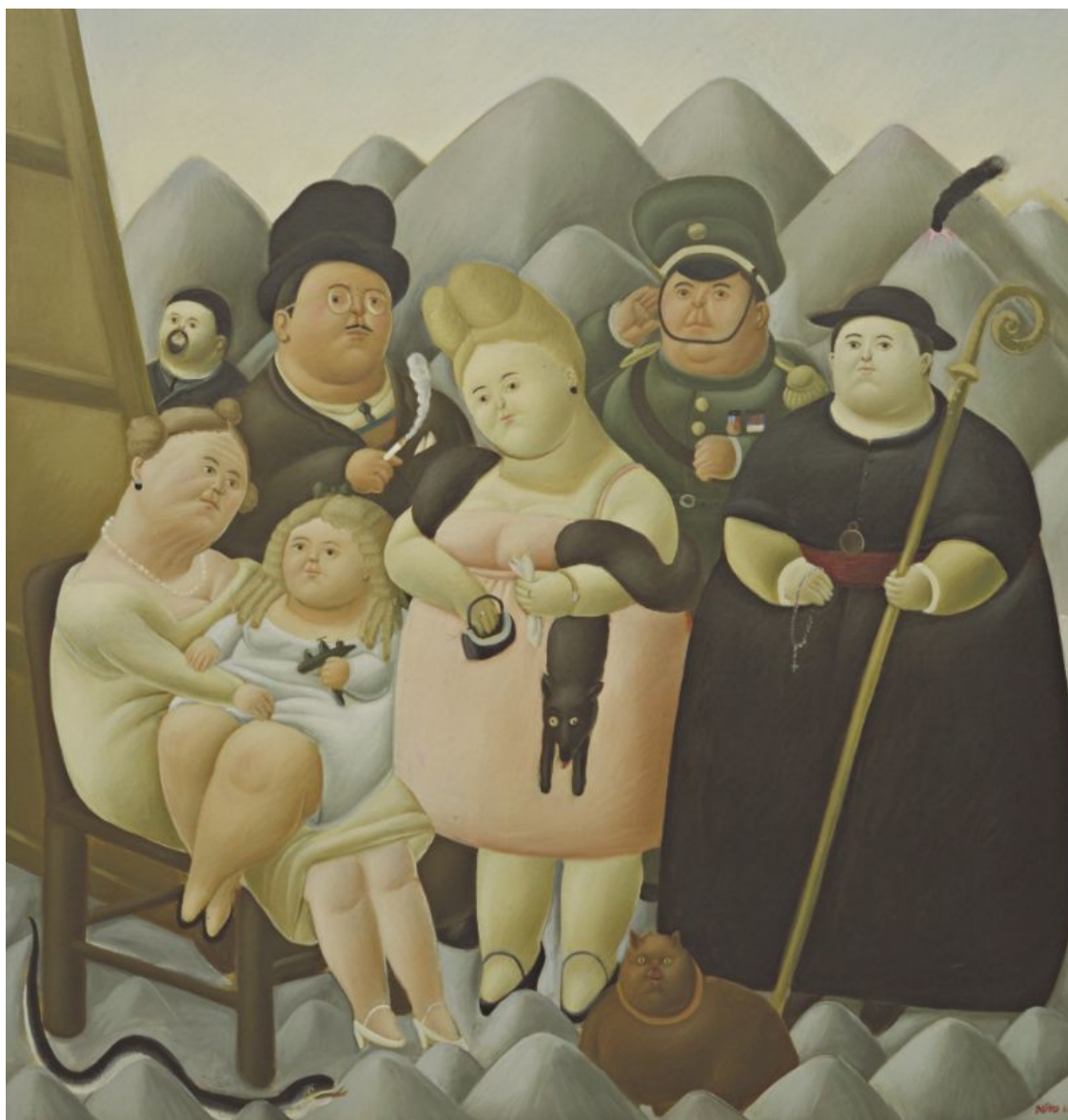
Fernando Botero, La familia presidencial, 1967