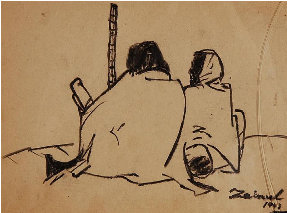
Zainul Abedin, Famine Sketches [Bocetos de la hambruna], 1943