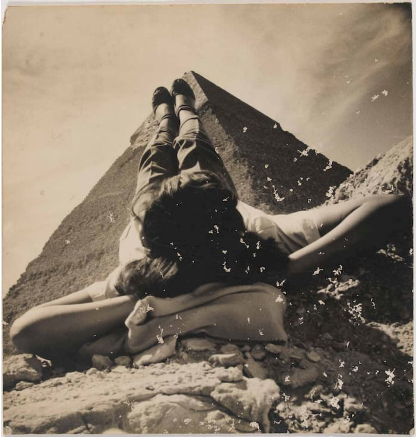
Abduh Khalil (Egipto), Untitled , 1949.

El coronavirus ya ha llegado a Palestina, y lo que es más alarmante, hay al menos un caso en Gaza, que es una de las prisiones al aire libre más grandes del mundo. El poeta comunista