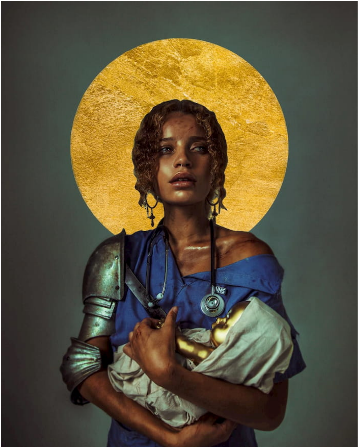
Haris Nukem, Counting Blessings , 2019.