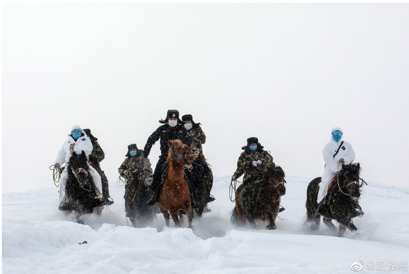
Médicxs chinxs en las montañas Altai.

Por siglos la humanidad ha enfrentado con gran dolor los cataclismos de muerte que poco comprende, siendo las plagas y la cólera los más notables. Cuando las catástrofes golpean, usualmente son las mujeres —como enfermeras, madres y hermanas— quienes han mantenido a la sociedad unida. Ha habido innumerables explicaciones misteriosas y místicas. La ciencia nos a ayudado a romper el profundo fatalismo que ha debilitado a los pueblos; ahora buscamos explicaciones en las secuenciación de genes y en la creación de vacunas. Es la creencia en la razón, en la ciencia y en la solidaridad lo que hizo que médicxs y enfermerxs chinxs fueran hasta los confines de su país, como a las montañas Altai, para sanar a personas y contener este peligroso virus que nos ha envuelto en ansiedad y muerte; es eso lo que hizo que fueran, junto con médicxs cubanxs, a Irán, Irak e Italia para ayudar a esos países en peligro. Su llegada nos recuerda la historia de más de un siglo de médicxs y enfermerxs socialistas que se han lanzado a la solidaridad internacional por el bien de la humanidad. Se trata de personas que comparten una perspectiva ética con los médicxs comunistas indixs y sus policínicos populares, sobre los que escribimos en el dossier nº 25 (febrero de 2020). Esta es la tradición socialista.