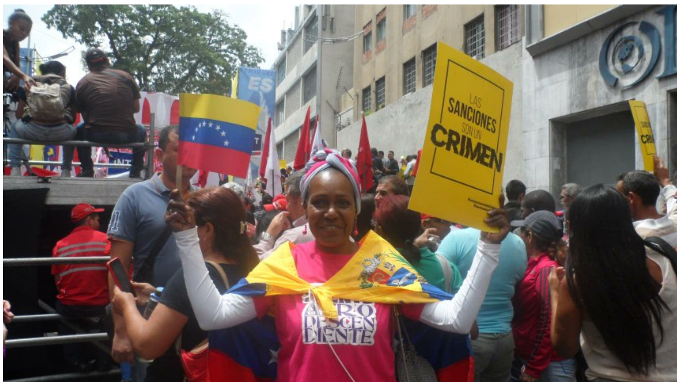
Las sanciones son un crimen, Caracas, Venezuela, 2020.