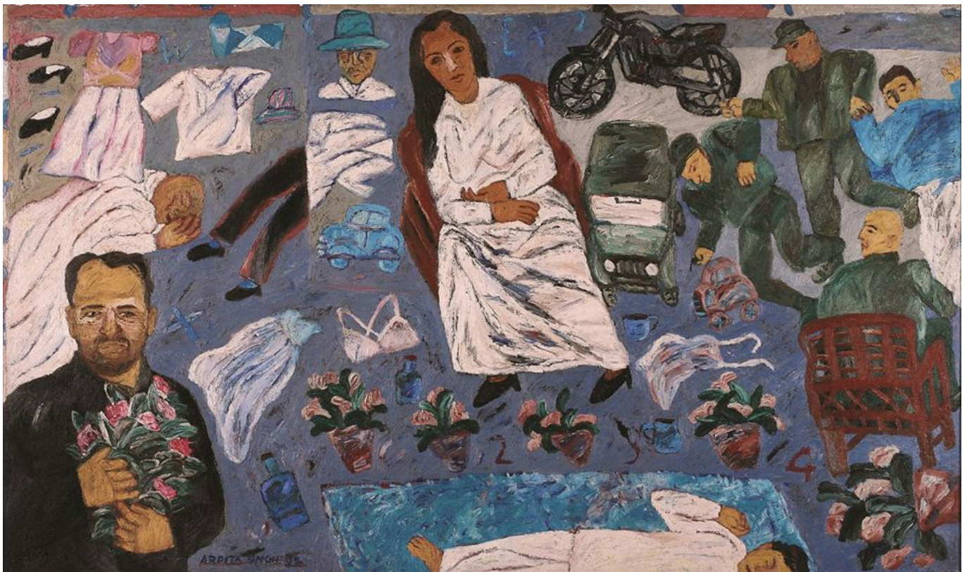
Arpita Singh (India), What Are You Doing Here? [¿Qué haces aquí?], 2000.

El Partido Comunista —PCI(M)— y los medios de comunicación habían criticado recientemente al gobierno estatal dirigido por el BJP. El partido y otras organizaciones salieron a la calle para protestar contra una serie de políticas, protestas que han obtenido un apoyo considerable de la población. El PCI(M) fue un componente clave del Frente de Izquierda, que gobernó el estado de Tripura de 1978 a 1988 y de 1993 a 2018.