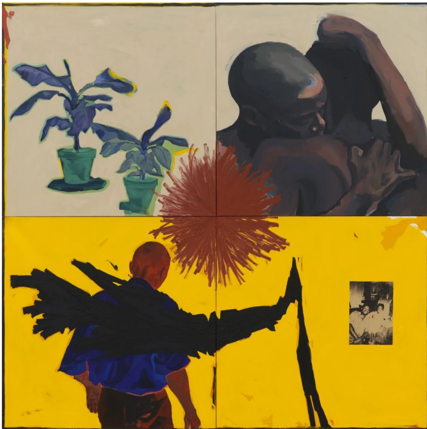
Kudzanai-Violet Hwami (Zimbabwe), A Theory on Adam [Una teoría sobre Adán], 2020.

Marikana de 34 mineros de las minas de platino explotadas por Lonmin (empresa minera británica). El cinturón del platino en Sudáfrica ha vivido una tensión extrema no solo por el asesinato de Mdazo y la masacre de Marikana, sino también por la forma habitual en que los socios de las empresas mineras —incluidos los sindicatos rivales— resuelven los conflictos laborales mediante una violencia nefasta.