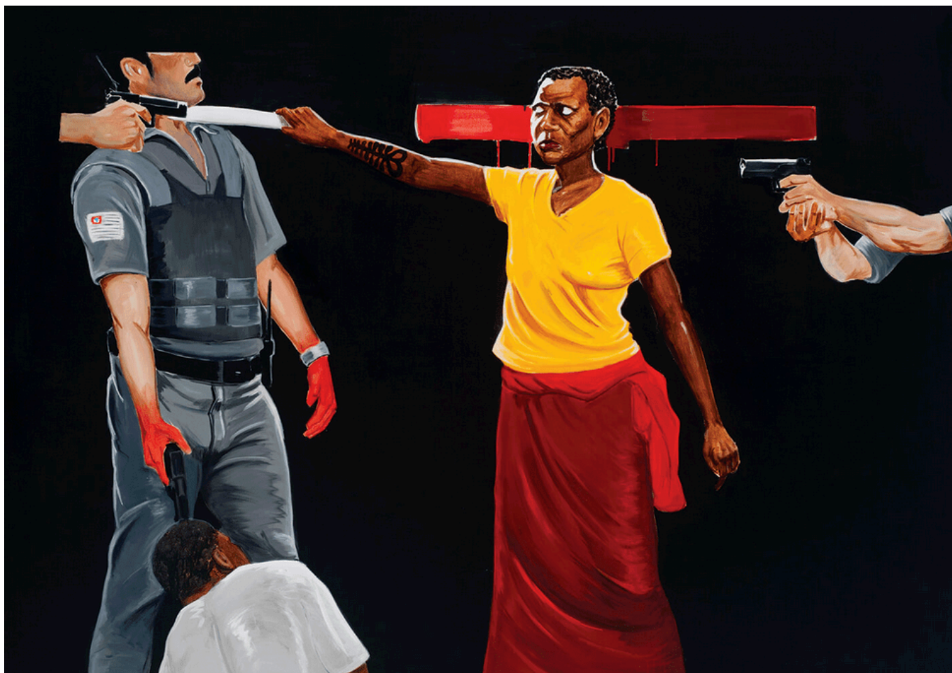
Sidney Amaral (Brasil), Mãe Preta ou A Fúria de Iansã [Madre Negra o la Furia de Yansá], 2014.