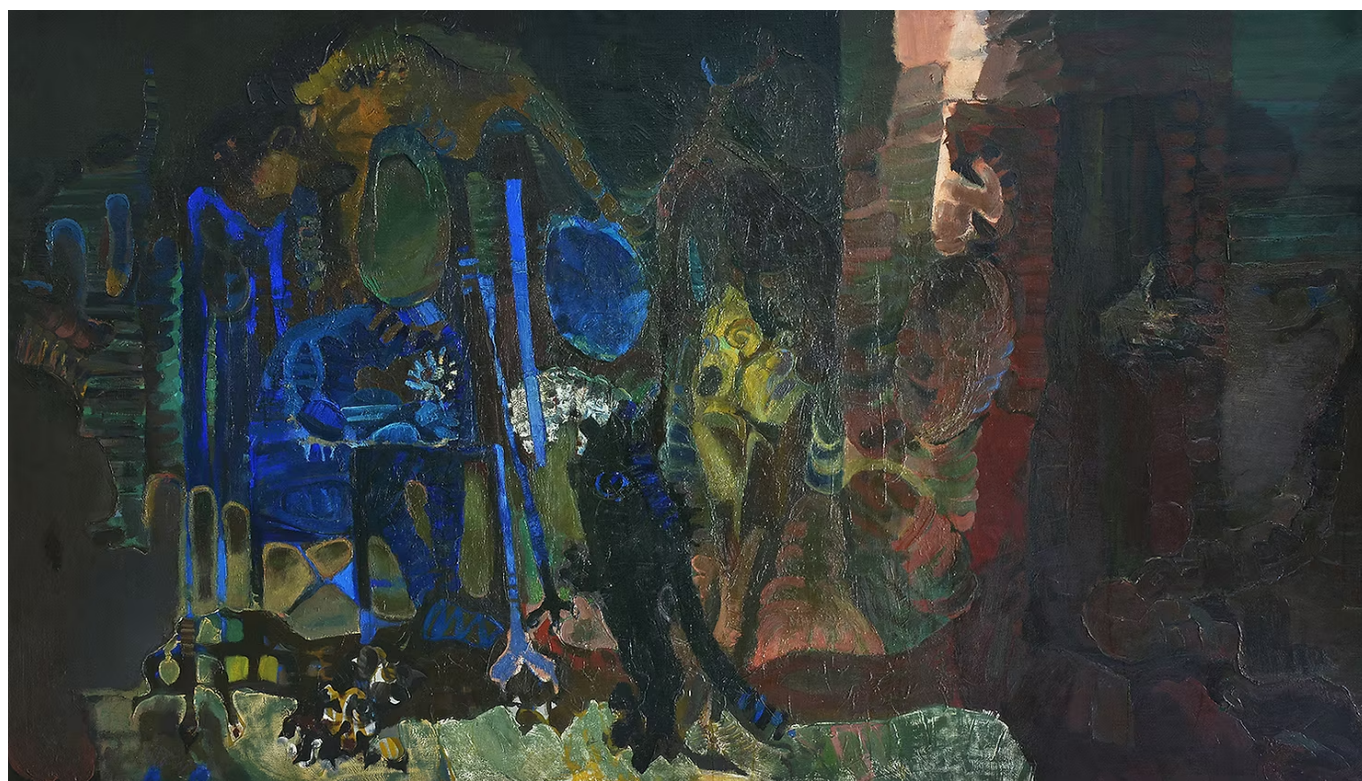
Vlady (México), Mecanismo Carcelario , (1958-1959).

Lo que el modelo de los Cuadrantes de Paz plantea es que una política de seguridad construida con participación comunitaria organizada, desde el barrio donde vive la clase trabajadora y no en su contra , como el modelo Bukele, puede dar resultados efectivos. Puede servir de orientación hacia la izquierda que anclar la seguridad a la construcción del poder popular en el territorio es más efectivo que la punición.