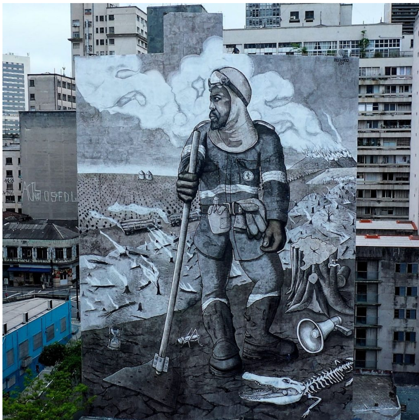
Mundano (Brasil), O Brigadista da Floresta [El brigadista forestal], 2021. Un mural de 46 metros de altura