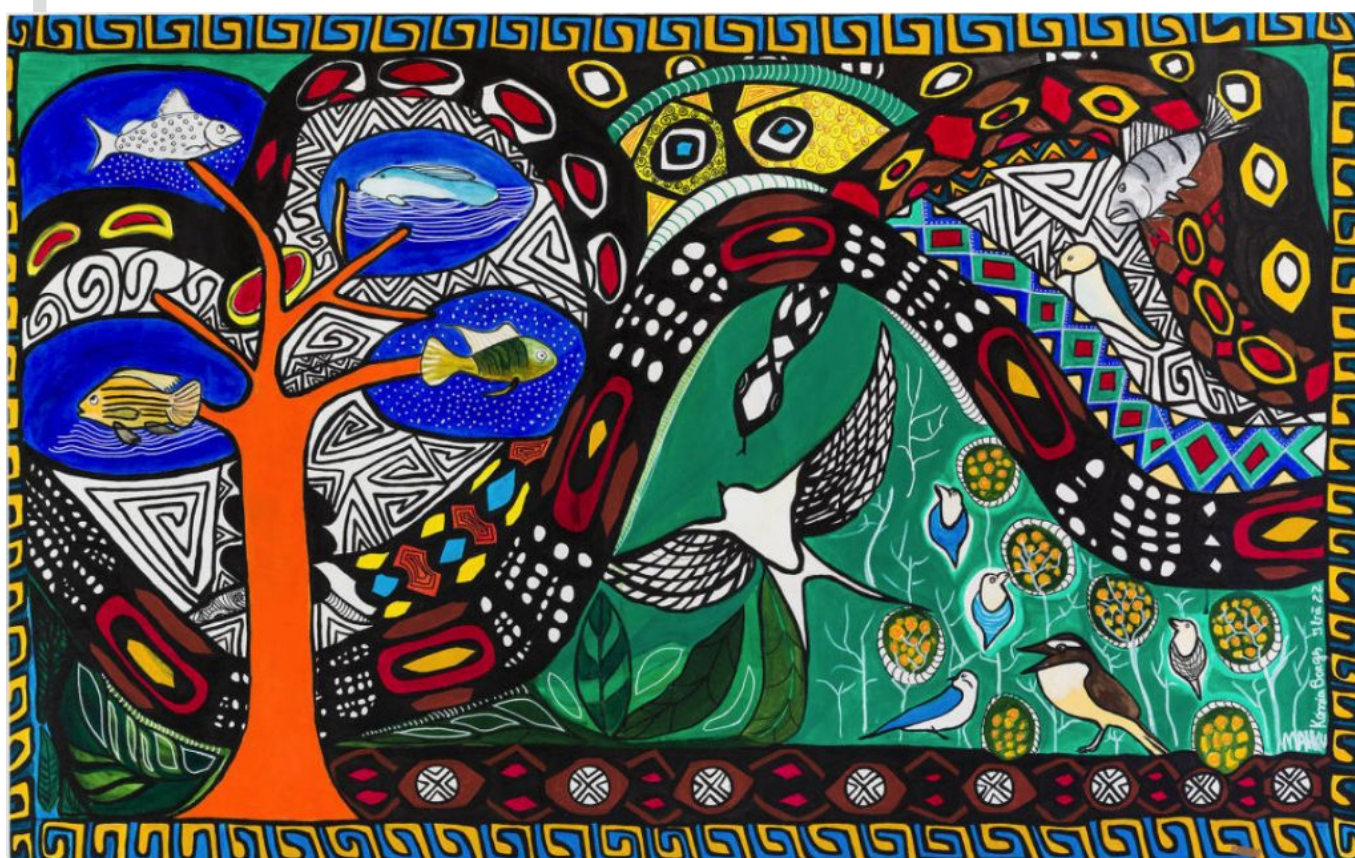
Colectivo MAHKU (Brasil), Rashuaka, 2022.

Esta lógica es articulada a partir de dos pilares centrales: la primacía absoluta de la acumulación (que coloca a las soluciones de mercado por encima de la integridad ecológica) y la visión colonial que trata al Sur Global como zonas de sacrificio, destinadas a prestar “servicios ambientales” para mantener el patrón de vida y de consumo de las potencias del Norte. Así, mientras la Amazonía y los biomas son divididos en métricas de carbono, “planes de manejo” y energías llamadas renovables, no hay ninguna disposición internacional para enfrentar el núcleo del problema: el modo de producción capitalista, que continúa definiendo patrones tecnológicos, regulatorios y financieros que atan al Sur Global a un papel subalterno.