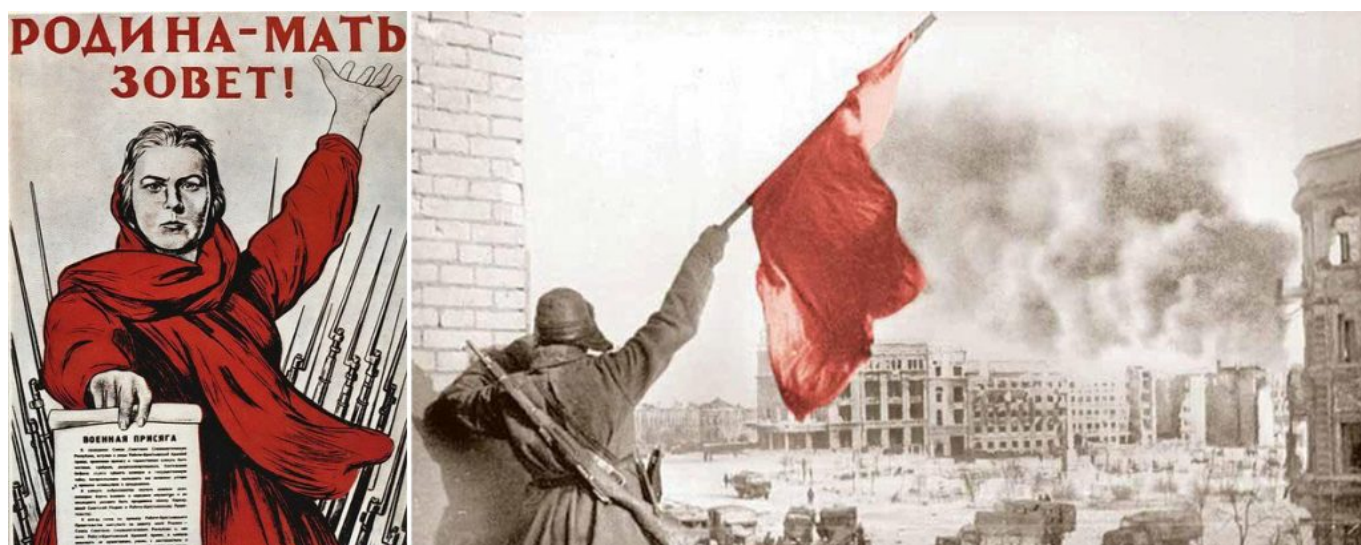
Izquierda: Cartel ¡La Patria llama! con juramento militar. Derecha: Bandera de la victoria en la Plaza de los Caídos en Stalingrado, 1943.