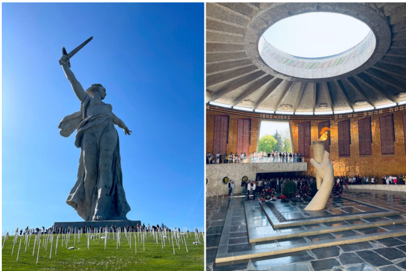
La estatua La Madre Patria llama y la Llama Eterna en Mamáev Kurgan, Volgogrado.

través de la poesía, la pintura, los carteles y las canciones, dando valor a lxs soldadxs en el frente y despertando a la nación.