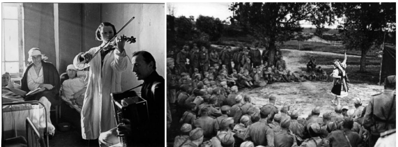
Izquierda: Brigadas culturales soviéticas en el Hospital de Evacuación No. 2386. Derecha: En el frente, ca. años 1940.

Pese al asedio, según un testimonio , la gente buscaba consuelo en la poesía: “ávidxs de cultura, lxs trabajadorxs asisten a una velada literaria improvisada. Permanecen inmóviles y absortxs, ignorando las bombas que caen afuera”. Como la obra de innumerables poetas, las palabras de Bergholz buscaban cumplir su promesa: “Nadie es olvidado, nada es olvidado”. Quizás la estatua en Stalingrado sea la propia Dariya Vlásievna, o cualquiera de las millones de mujeres soviéticas que resistieron al fascismo, madres, esposas, hermanas, hijas, soldadas y comandantas del Ejército Rojo, obreras fabriles y científicas en el frente, enfermeras, doctoras, periodistas y poetas, para no ser olvidadas.