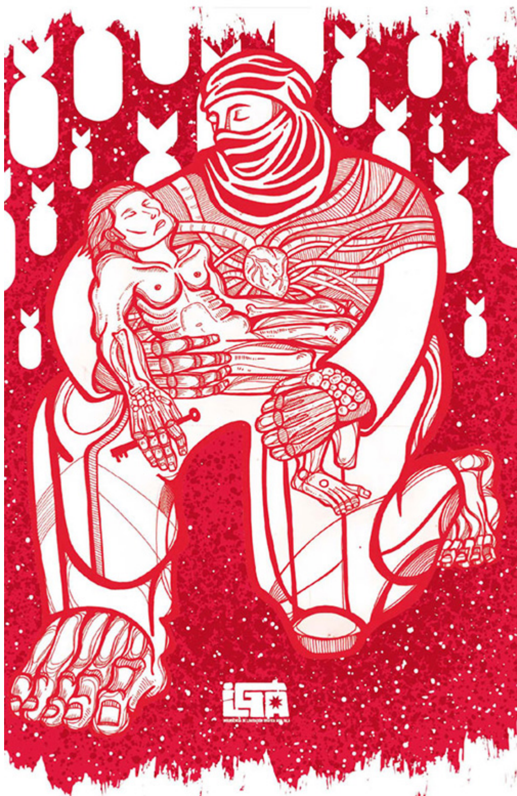
Ilga (Palestina y Chile), Palestina resiste , 2016.

En 2023, varios miembros de PYM formaron un comité para producir colectivamente La trinidad de los fundamentos en inglés. Publicada en enero de 2024 por 1804 Books y traducida por el Dr. Muhammad Tutunji, la nueva edición lleva la obra de Rafeedie a un público más allá del mundo árabe. “Pensamos que esta