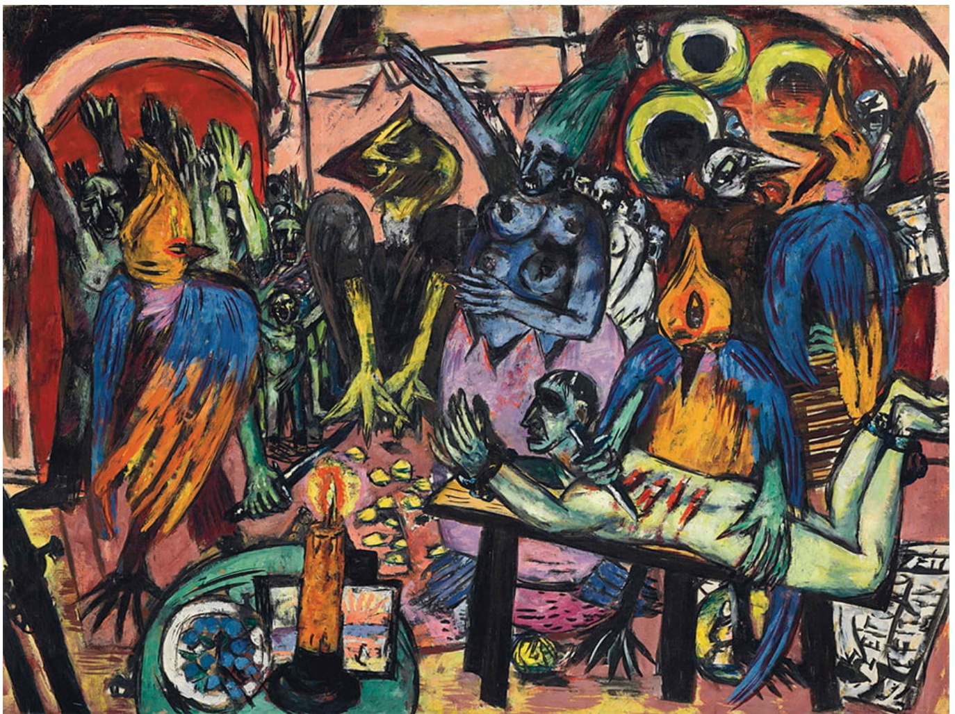
Max Beckmann, Hölle der Vögel, 1937-38.

Es liegt im Interesse des Bürgertums, jedes Vorhaben der Arbeiterklasse und der Bauernschaft zu zerschlagen. Dies geschieht sowohl durch Gewaltanwendung und durch das Gesetz als auch durch das Wunschbild des erfüllten Augenblicks, also durch die Schaffung von Sehnsüchten innerhalb des Kapitalismus, welche die politische Grundlage für eine postkapitalistische Gesellschaft zunichtemachen. Parteien der Arbeiterklasse und der Bauernschaft werden verspottet, weil sie es nicht verstehen, eine Utopie innerhalb der Grenzen des Kapitalismus zu produzieren; sie werden für ihre angeblich unrealistischen Vorhaben verspottet. Das Wunschbild des erfüllten Augenblicks, die gotischen Träume, gelten als realistisch, wogegen die Notwendigkeit des Sozialismus als unrealistisch abgestempelt wird.