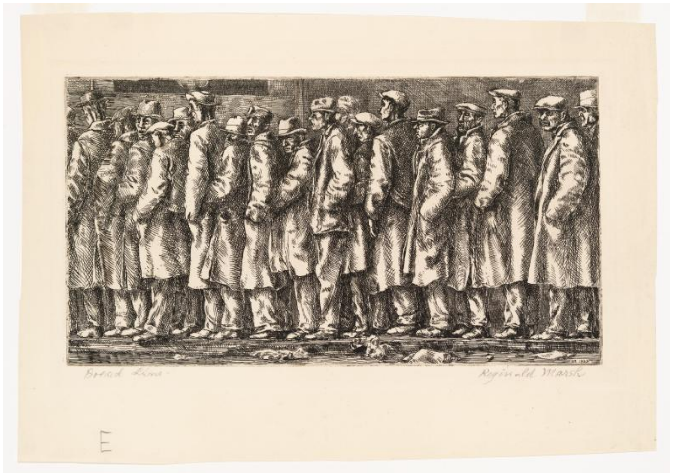
Reginald Marsh, Bread Line - No One Has Starved, 1932.

Das Trugbild wird noch mächtiger, wenn die Grundstrukturen der sozialen Wohlfahrt – die auf das Drängen der Leute hin in die Regierungsprogramme aufgenommen wurden – zerfallen. Um die Brutalität der sozialen Ungleichheit, die aus der privaten Aneignung des gesellschaftlichen Reichtums durch die Bourgeoisie entstanden ist, zu mildern, wird der Staat vom Volk gezwungen, Sozialhilfeprogramme zu schaffen – öffentliche Gesundheit und Bildung sowie gezielte Programme für die Bedürftigen und die arbeitenden Armen. Ohne diese Programme werden die Menschen in größerer Anzahl auf der Straße sterben, was das Wunschbild des erfüllten Augenblicks in Frage stellen würde. Infolge der langfristigen Rentabilitätskrise wurden jene Programme jedoch in den letzten Jahrzehnten zurückgefahren. Aus dieser Krise der liberalen Demokratie im Zuge der neoliberalen Sparpolitik resultieren eine hohe wirtschaftliche Unsicherheit und eine wachsende Wut auf das System. Eine Rentabilitätskrise wird zu einer politischen Legitimationskrise.