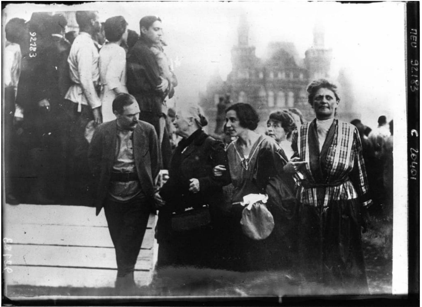
Clara Zetkin und ihre Genoss*innen an der zweiten internationalen kommunistischen Frauenkonferenz, Moskau, 1921.>

1920 schrieb die bolschewistische Anführerin Alexandra Kollontai, dass die Frauen in der Sowjetrepublik zwar Stimm- und andere Rechte hatten, aber «das Leben selbst sich nicht grundlegend verändert hat. Wir sind erst noch im Begriff, für den Kommunismus zu kämpfen, und sind umgeben von einer Welt, die wir von der dunklen und repressiven Vergangenheit geerbt haben». Die Zukunft lag im Kampf. Im nächsten Jahr legte die zweite internationale kommunistische Frauenkonferenz den 8. März als Datum für den internationalen Frauentag fest. Dieser Tag würde letztendlich – dank der Arbeit der Internationalen Demokratischen Frauenföderation – 1977 von den Vereinten Nationen aufgenommen werden.