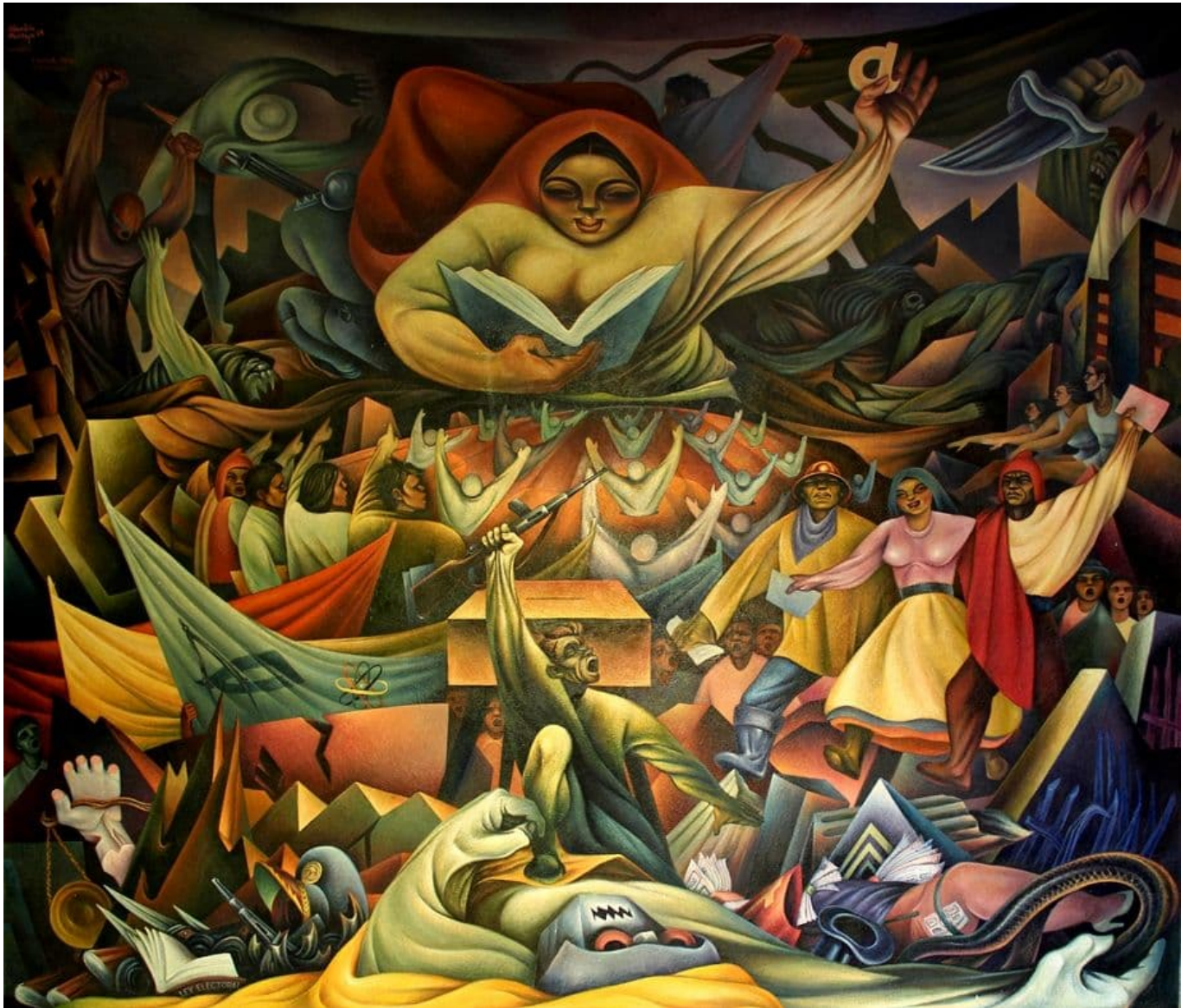
Miguel Alandia Pantoja, La educación (Die Bildung), 1960, el Monumento a la Revolución Nacional, La Paz, Bolivien.

Der honduranische Präsident Hernández trat 2018 seine zweite Amtszeit an, nachdem Wahlbetrugsvorwürfe im ganzen Land zu Massenprotesten geführt hatten; Hernández reagierte mit Tränengas und Scharfschützen. Im Büro der Organisation Amerikanischer Staaten (OAS) runzelte niemand die Stirn. Die Regierung der Vereinigten Staaten begünstigt Hernández trotz sämtlicher gegen ihn laufenden Ermittlungen wegen Drogenhandels. Das ganze Wahlbetrugsgeschäft ist mittlerweile zutiefst politisch, wobei Organisationen wie die OAS als Waffe zur Untergrabung linker Regierungen eingesetzt wurden. Eine neue Studie zweier Forschenden des Massachusetts Institute of Technology (MIT) zeigt, dass bei den bolivianischen