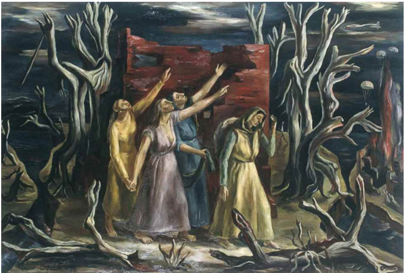
Raquel Forner (Argentinien), Finsternis , 1943.

haben den Lockdown genutzt, um die Grundrechte auszuhöhlen. In Indien zum Beispiel hat die Regierung den Arbeitsschutz aufgehoben und die Zahl der Arbeitstage erhöht; in Brasilien und Südafrika sehen wir Beweise für die Vertreibung der ärmsten Arbeiter und Bauern aus ihren Häusern. Von Bolivien bis Thailand sehen wir, dass Staatsstreiche sanktioniert und Wahlen verzögert werden. Die Morde an politischen Aktivist*innen von Kolumbien bis Südafrika und die Inhaftierung von Dissident*innen von Indien bis Palästina gehen weiter. Ohne die demokratischen Institutionen völlig außer Kraft zu setzen, ersticken diese Regierungen demokratische Prozesse, und bedienen sich dabei demokratischer Institutionen.