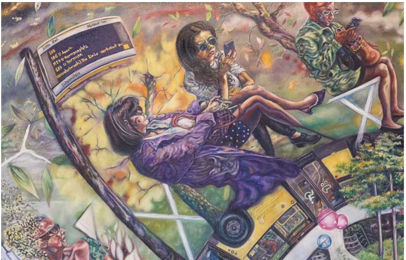
Deur Sokuntevy (Kambodscha), Auf den Kopf gestellt , 2017.