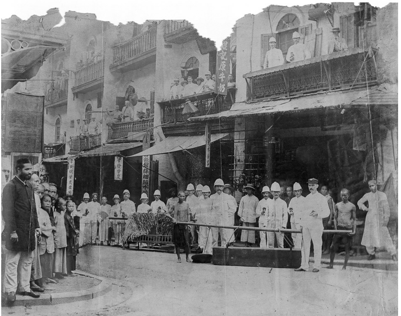
Staffordshire Regiment während der Pest, Hongkong, 1894.